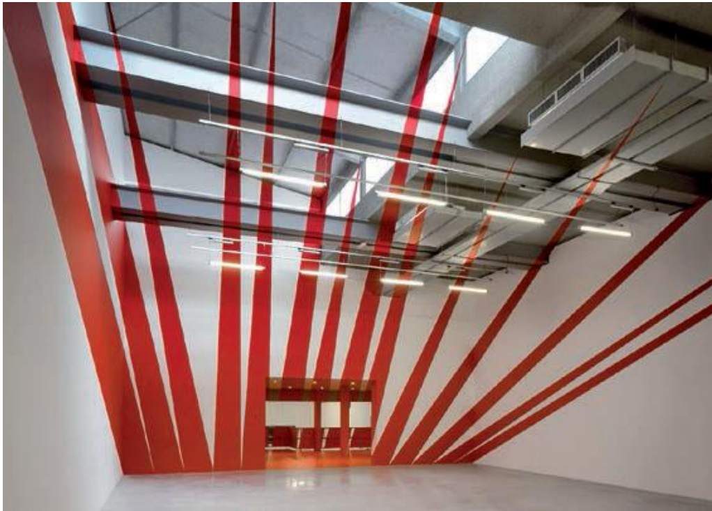
Fig. 5 Quatorze triangles , La maison rouge, Paris 2007.

cercle se fractionne en une multitude de surfaces jaunes, comme autant de petites oeuvres presque autonomes et indépendantes de leur ascendance au cercle (fig. 8). Une fois le hall traversé, en se retournant, on aperçoit, au-delà du premier cercle disloqué, le second, exactement en place, créant une nouvelle illusion.