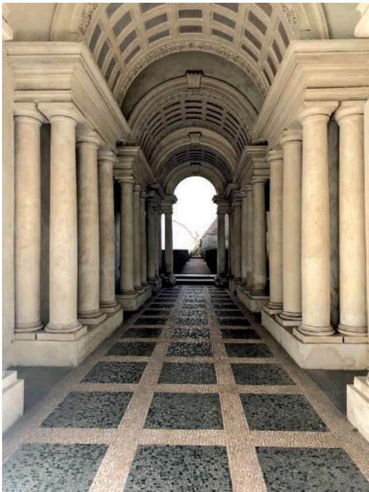
Fig. 11 Colonnade en perspective de Francesco Borromini, 1632. Galerie Spada, Rome. Le sol et le plafond ne sont pas droits, ni les murs ; les premières colonnes font plus de 5 m et les dernières moins de 2,5 m. L'illusion fait croire que la galerie est longue de 37 m alors qu'en fait elle mesure 8 m.