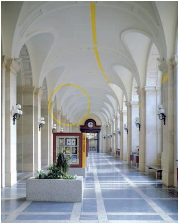
Fig. 6 Hôtel des Postes , cercle jaune au sud-est, Genève 1991. Hôtel des Postes de la rue du Mont-Blanc.