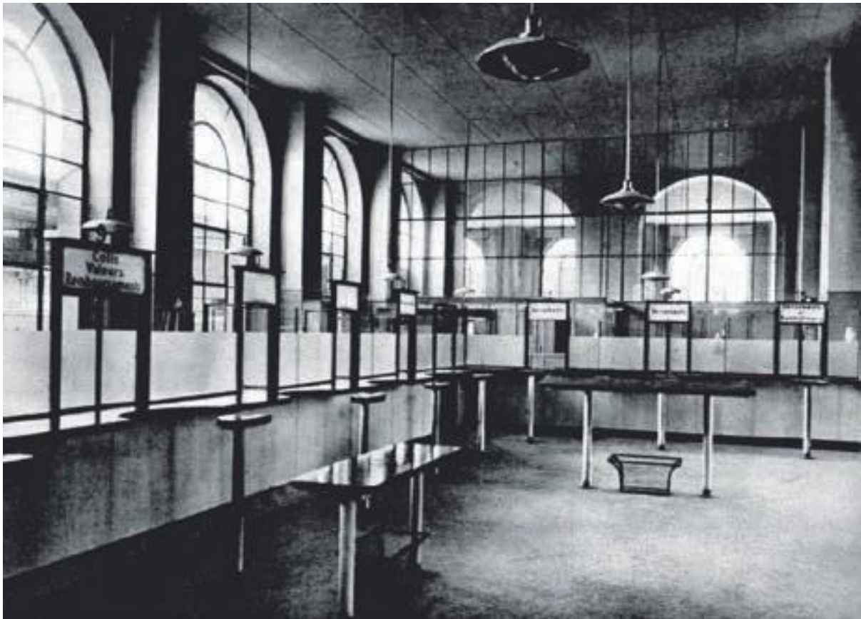
Fig. 4 Grand hall des guichets transformé par l'architecte Adolphe Guyonnet. Tiré de « Transformation à l'Hôtel des Postes, Mont-Blanc à Genève : architecte A. Guyonnet, F.A.S. », in Habitation , nos 11-12, 1943