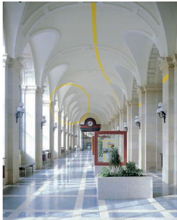
Fig. 7 Hôtel des Postes , cercle jaune au nord-ouest, Genève 1991. Hôtel des Postes de la rue du Mont-Blanc.