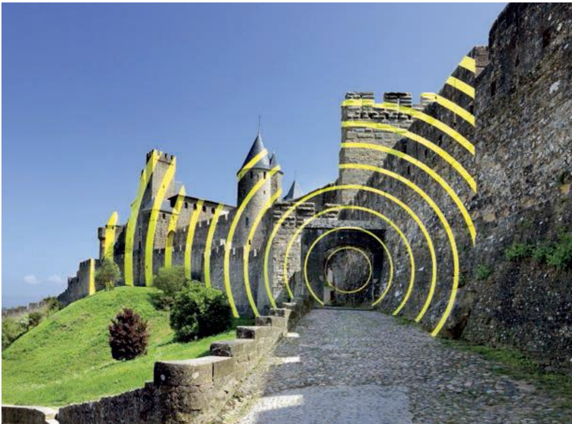
Fig. 10 Cercles concentriques excentriques , Carcassonne 2018, 7e édition d'IN SITU Patrimoine et art contemporain, au château et remparts de la Cité de Carcassonne, Port d'Aude.