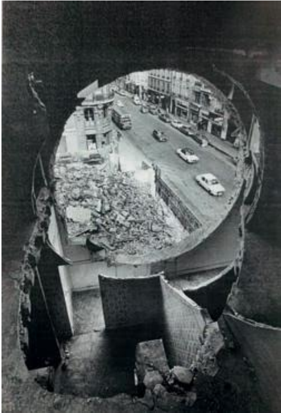
Fig. 12 Gordon Matta-Clark, Conical Intersect , 1975, 27-29 rue Beaubourg, Paris. Tiré de Pamela M. Lee, Object to be destroyed : the work of Gordon Matra- Clark , Cambridge Mass. – Londres, The MIT Press, 2000, p. 182