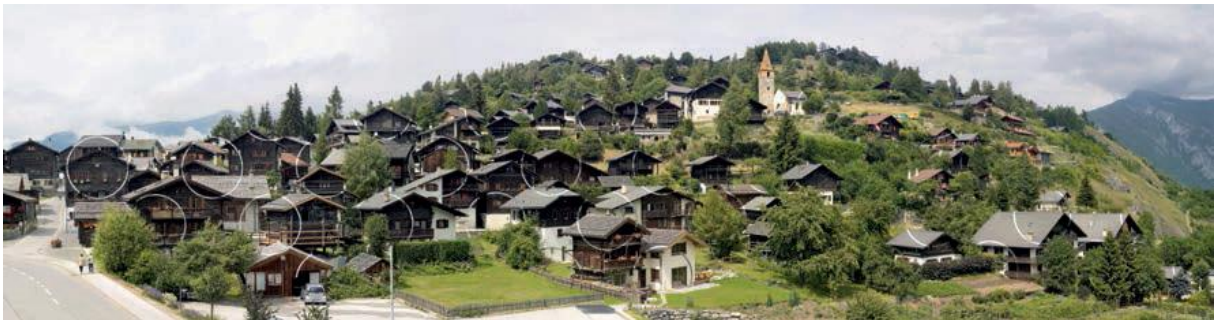
Fig. 1 Cercle et suite d'éclats, Vercorin 2009, exposition sur site à Vercorin, Suisse.

L'histoire de Felice Varini est celle d'un artiste qui a voulu s'émanciper des limites de la toile. Que pouvait-il peindre au-delà du cadre ? Il a commencé par un mur, puis deux, le plafond, le sol, les fenêtres et finalement toute l'architecture. Puis, de l'intérieur des bâtiments, il est passé à l'extérieur et a entrepris de peindre des villages 1 (fig. 1) et des villes.