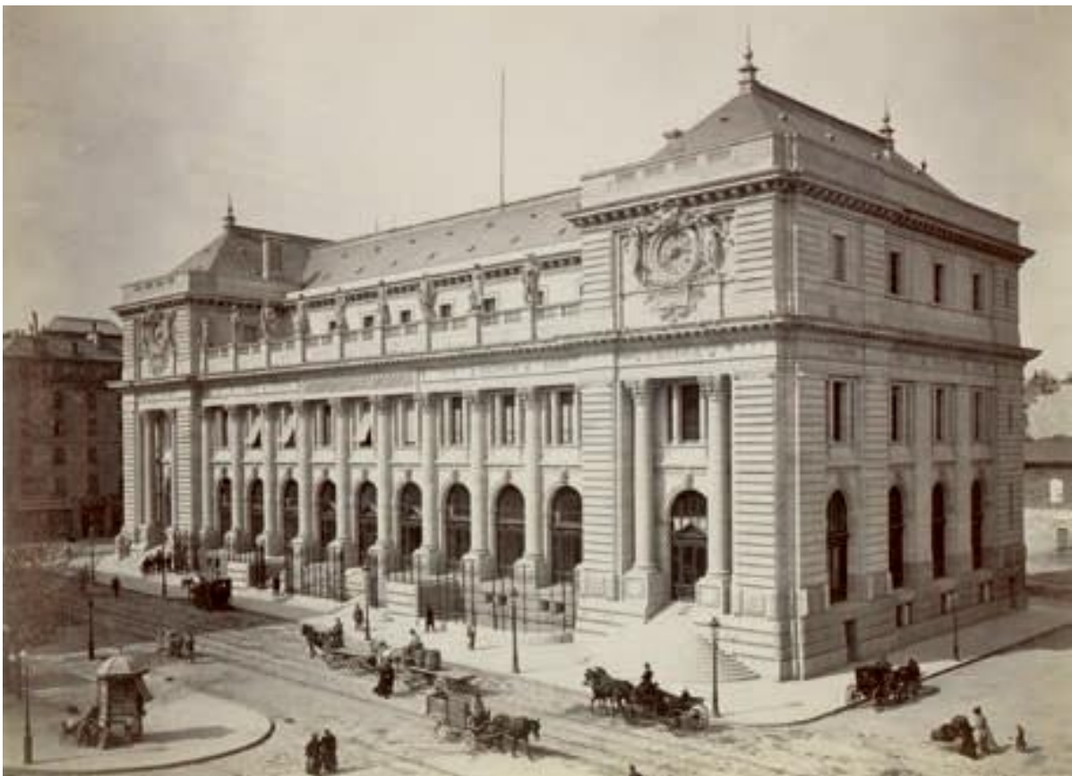
Fig. 3 Hôtel des Postes de la rue du Mont-Blanc, Genève. Photographie anonyme, entre 1875 et 1893.