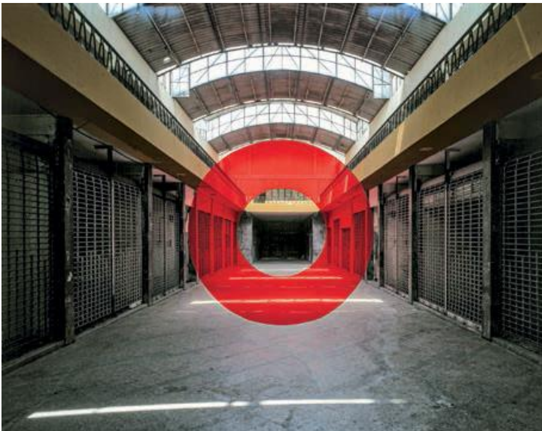
Fig. 13 Lima, oeuvre réalisée avant la destruction du marché couvert à Mira florès, Lima, 2008. © Georges Rousse / ADAGP 2020