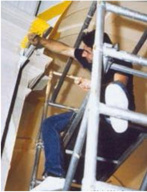
Fig. 9 Felice Varini en action, en octobre 1991.

avec son support architectural et son environnement : que deviendraient les cercles jaunes de la poste du Mont-Blanc dans une salle muséale contemporaine, sans aucun de ces « accidents » qui font le jeu de l'artiste ?