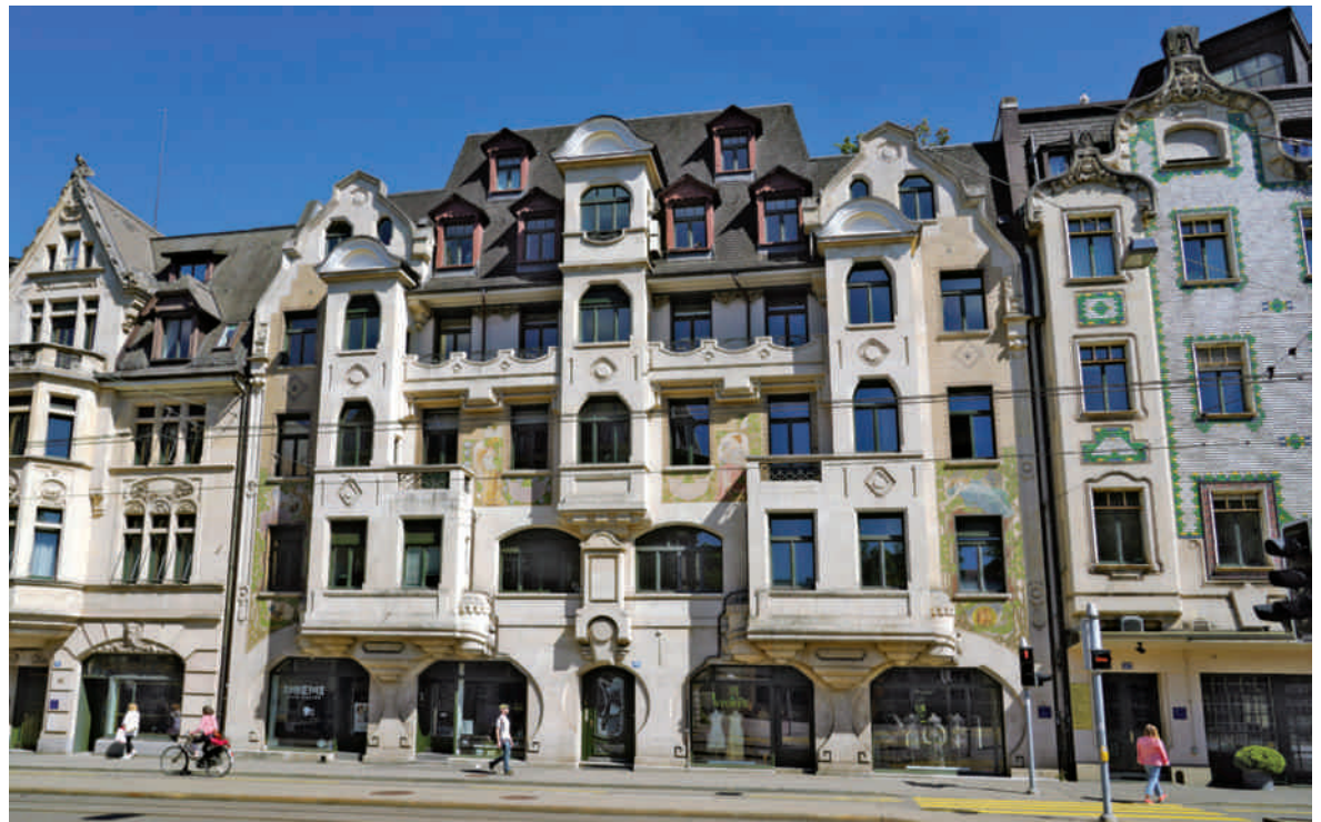
«Gublerhaus» Zürich, Bleicherweg 45, Chiodera & Tschudy, 1905. Antonio de Gradas allegorische Fassadenmalereien orientieren sich an internationalen Vorbildern, etwa aus Frankreich und Spanien, und sind in Zürich eine Seltenheit. Die stilistische Nähe zu Arbeiten von Alfons Mucha ist unverkennbar.

des Daches tritt die teppichartige Tafel der Fassadenwand, an der Backsteinpartien mit solchen aus Naturstein (Savonnière) und bemalten Putzflächen geschickt verzahnt sind. Zu der flächig gehaltenen Wand tritt mit den drei Erkervorbauten und den Balkonnischen ein reiches Licht/Schatten-Spiel. Die Umrisslinien der Einzelkörper sind durch plastische Elemente betont, so zum Beispiel an den Konsolen der Erker. Die Malereien, die die Putzflächen ganz bedecken, sind von hoher Qualität. Dargestellt sind die vier Tageszeiten Morgen, Mittag, Abend und Nacht, symbolisiert durch vier Frauengestalten, die erste begleitet vom Hahn, die letzte von zwei Eulen.» 3 Die an Plakatsymbole des in Paris und den Vereinigten Staaten tätigen Tschechen Alfons Mucha erinnernden Fassadenmalereien im Piano Nobile der Häuser Nr. 41 und 45 – in Zürich eine Seltenheit – sind Arbeiten des aus Mailand stammenden Künstlers Antonio de Grada (1858–1938). Er wirkte zuvor auf Anregung Alfred Chioderas u.a. an der Ausgestaltung der Villa Maria an der Freigutstrasse und der Villa Patumbah an der Zollikerstrasse mit. 4 Im Kopfbau Nr. 47, dem eigentlichen «Chachelihuus», kulminieren das barocke Bauvolumen und seine Dekoration: Der mit drei Schauseiten ausgestattete Baukörper wird von markanten Schweifgiebeln und einem zentralen Korbbogenreifen charakterisiert. Prägend und namensgebend sind die farbigen Keramikfliesen, die, in geometrischen Mustern verlegt, die Fassaden der Obergeschosse nahezu vollständig bedecken.