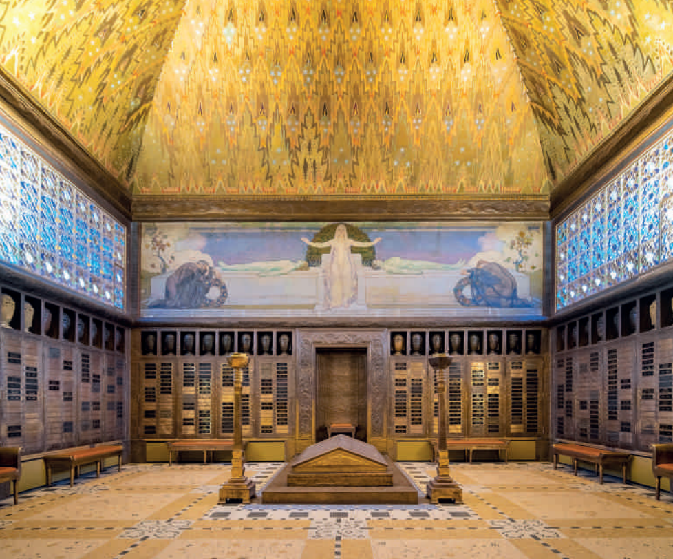
Crématoire de La Chaux-de-Fonds, Robert Belli und Henri Robert, 1910. Vor allem das künstlerisch gestaltete Interieur des neuen Krematoriums strahlt im modernen Glanz des Jugendstils. Raum-, Bild- und Formschöpfungen der Wiener Secessionisten um Koloman Moser finden hier ihre Entsprechung.