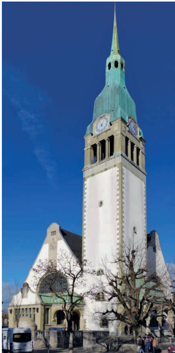
Pauluskirche Basel, Curjel & Moser, 1901. Nach der Fertigstellung der in neoromanischen Formen erbauten Basler Pauluskirche nahmen die neu erbauten Wohnhäuser des ringsum entstehenden Quartiers die Dekore und Materialien des Gotteshauses auf. Ansichtskarte von 1906, Privatsammlung