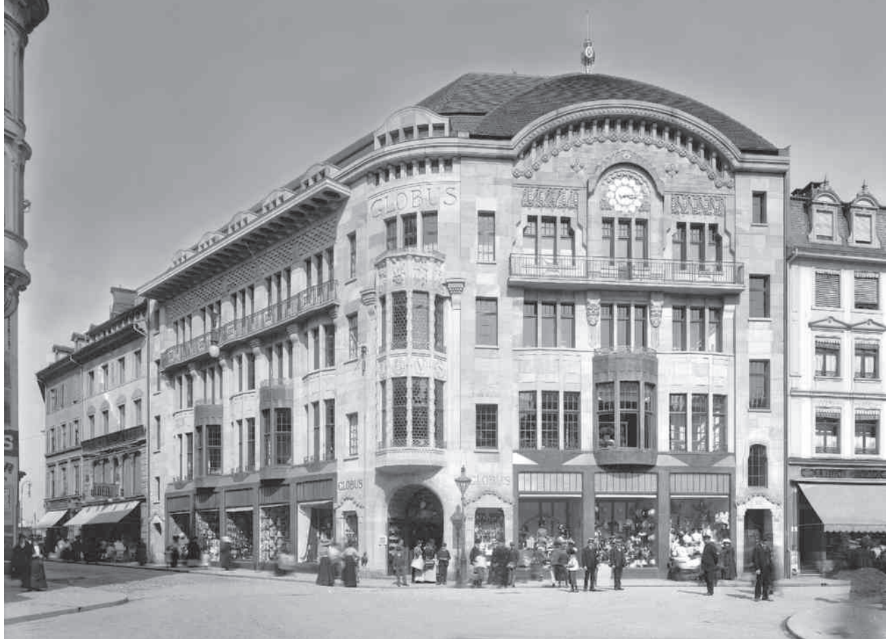
Schaubild des Geschäftshauses Breitenmoser & Cie. in St. Gallen, Wendelin Heene, 1906. Das monumentale Geschäftshaus am Vadianplatz etablierte zusammen mit anderen ähnlich genutzten und dimensionierten Bauten einen neuen Typus im Stadtbild des bedeutenden Stickereihandelsplatzes St. Gallen.

Magazine zum Globus Basel, vormals Warenhaus Julius Brann, Alfred Romang und Wilhelm Bernoulli, 1904. Aus dem ursprünglich nur am Marktplatz stehenden Warenhaus Brann wuchs durch Erweiterungsbauten ein voluminöser und stadt-bildprägender Komplex. Die zeittypische Fassade des Ursprungsbaus ist bis heute weitgehend erhalten.