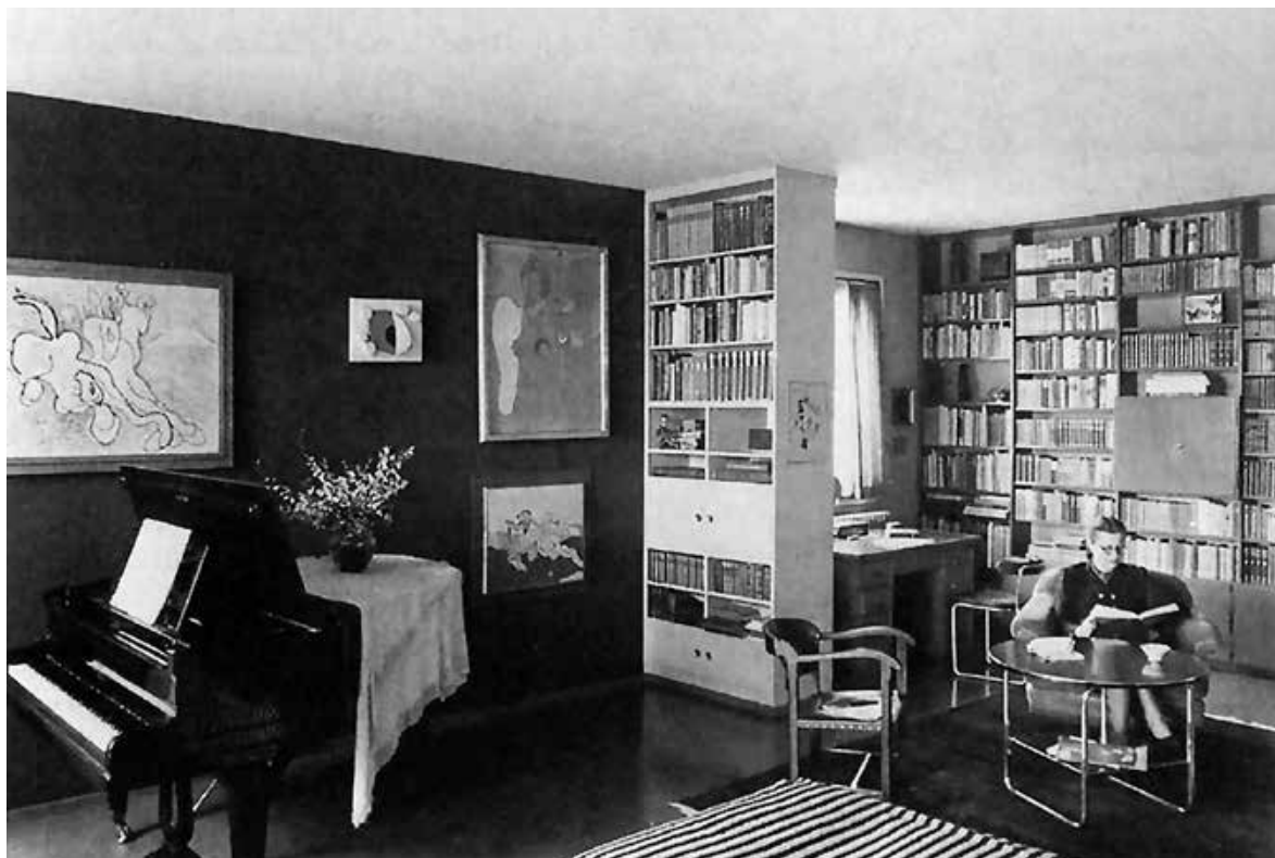
Elsa Burckhardt-Blum im Wohnzimmer ihres selbst geplanten Wohnhauses in Küsnacht Hesi-bach (1937). Aufnahme von Hans Finsler (Dorothee Huber. «Zur Architektur des Wohnens: Innenräume von Elsa Burckhardt-Blum, Flora Steiger-Crawford und Lux Guyer». In: Kunst+Architektur in der Schweiz , Bd. 48, Nr. 3, 1997, S. 13–19, Aufnahme S. 15)