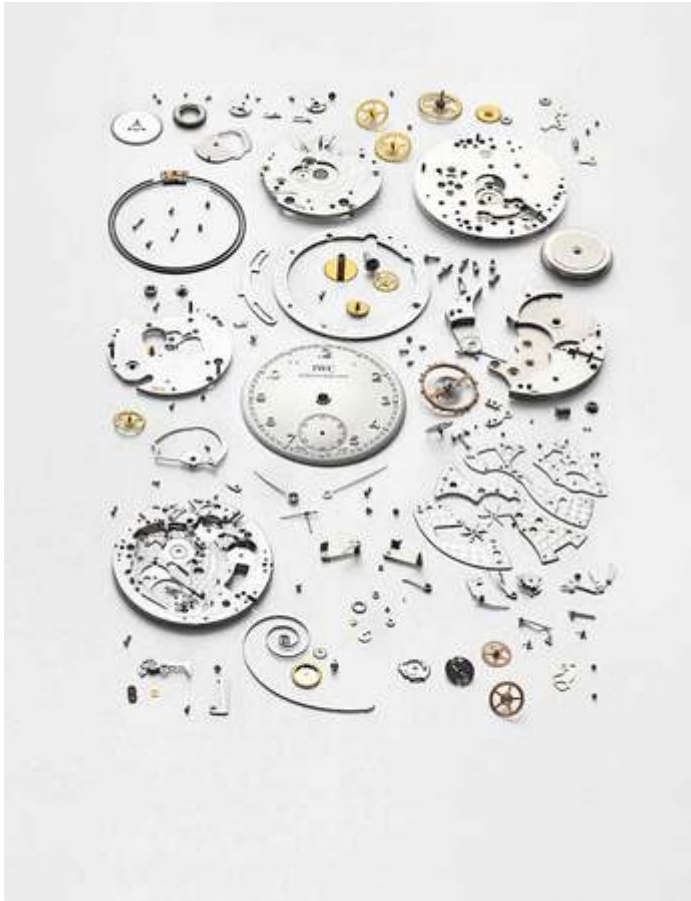
Uhrmacherkunstwerk: die Teile einer «Portugieser Minutenrepetition»