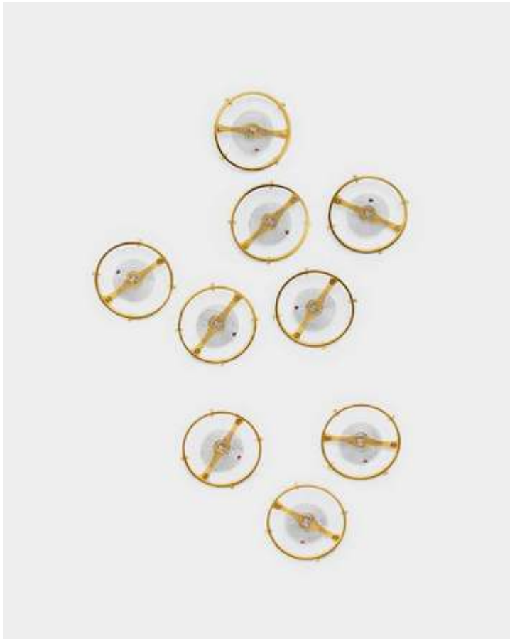
Die Breguet-Spirale: erfunden von einem der bedeutendsten Uhrmacher in der Geschichte der