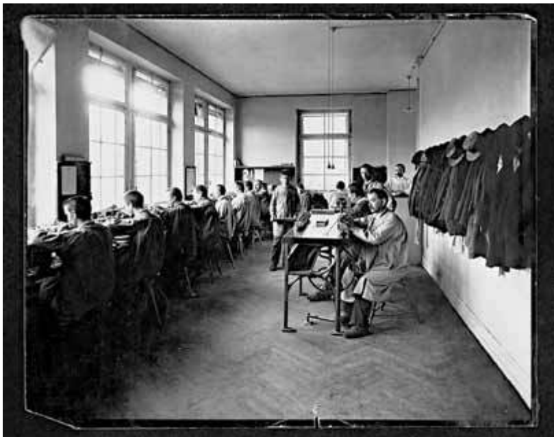
Uhrenherstellung bei IWC: um 1900 im Atelier