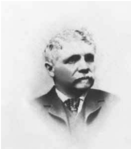
Florentine Ariosto Jones (1841-1916): IWC-Gründer und visionärer Unternehmer, der die Schweiz als Billiglohnland nutzen wollte

Soweit die Geschichte im Schnelldurchgang. Von F. A. Jones ist indes nicht nur der Firmenname geblieben. Zur DNA der Manufaktur gehört sicherlich das unbedingte Qualitätsbewusstsein, das der Amerikaner nach Schaffhausen mitgebracht hatte. Und es verbindet sich mit dem sprichwörtlichen Genius Loci und den Menschen der schweizerisch-deutschen Grenzregion: Es ist die Lust am Tüfteln und der Ehrgeiz, mit den besten Mitteln und der intelligentesten Anwendung der Mechanik möglichst perfekte Lösungen hervorzubringen. Das Sein, hier: Qualität, Genialität und Langlebigkeit der Werke, war bei IWC immer wichtiger als das Scheinen, wichtiger als Dekoration oder übertriebene Extrovertiertheit der Produkte, die häufig die «Genfer Uhr» auszeichnete. Das macht IWC-Uhren so eigenständig und unverwechselbar. Bis heute. Um dieses Ziel erreichen zu können, war es auch unverzichtbar, den eigenen Uhrmachernachwuchs heranzuziehen. Die hauseigene, vierjährige Ausbildung zum «Horloger complet» ist in der Branche hoch angesehen, die Absolventen sind entsprechend begehrt.