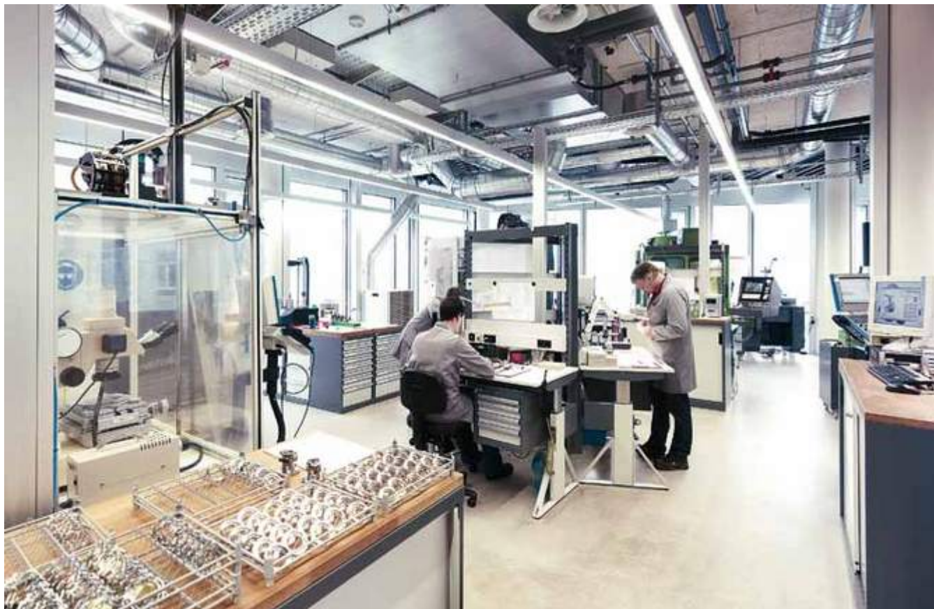
Uhrenherstellung bei IWC: im Jahr 2010