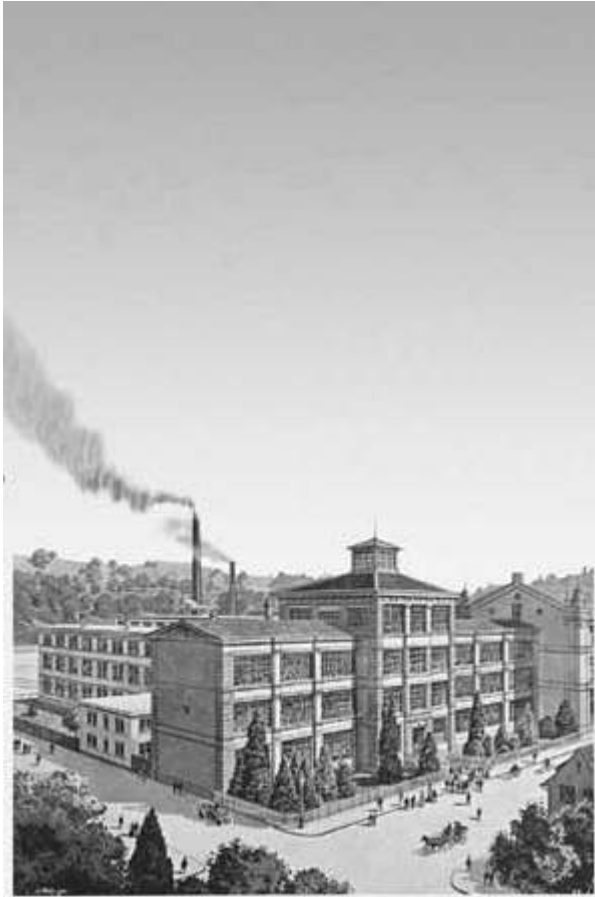
IWC-Stammhaus und -Produktionsgebäude um 1920

imprenditori dei Rauschenbach di Sciaffusa rilevò l'azienda e la portò al successo. I dipendenti vennero vincolati all'azienda per mezzo di prestazioni sociali esemplari. Ancora prima della svolta del XX secolo, la IWC comprese che l'orologio da polso, inizialmente privilegiato dalle donne, poteva costituire un'alternativa all'orologio da tasca. Anche le generazioni di titolari successivi, appartenenti alle famiglie Homberger e Blümlein, coltivarono con coerenza la filosofia di una produzione orologiera caratterizzata da qualità, genialità e durezza. La formazione di orologiaio presso la IWC, di durata quadriennale, con il conseguimento del diploma federale di «horloger complet», gode di grande considerazione nel settore