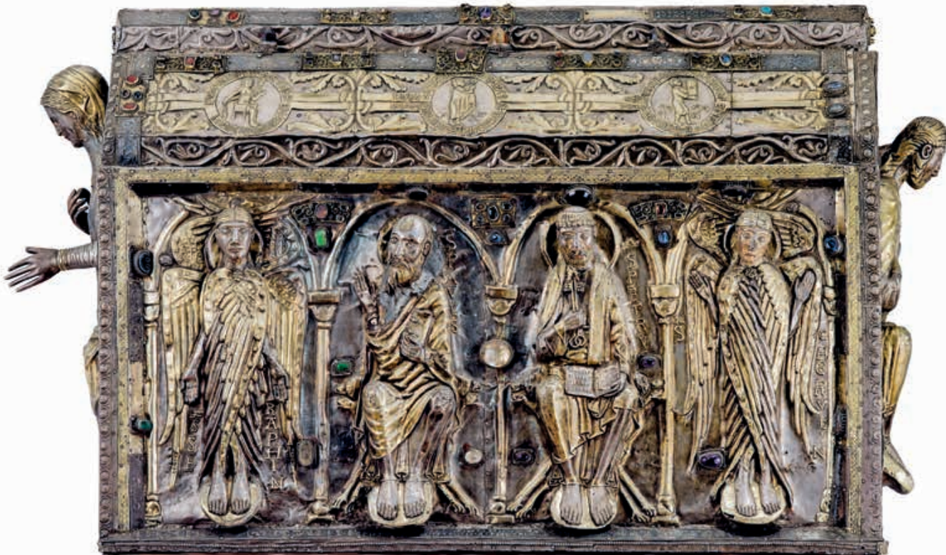
Fig. 2 Grande châsse de saint Maurice, Atelier de Saint-Maurice ?, vers 1150 et vers 1225-1230 (montage). Face D.

La Grande châsse de saint Maurice (fig. 1) est un reliquaire composite que la tradition locale retient du XVII e siècle, quand bien même plusieurs indices plaident en faveur d'un remontage contemporain ou de peu postérieur à la révélation des reliques du saint de 1225. Il ne fait aucun doute que cette châsse a été remaniée au cours du temps, comme en témoignent l'hétérogénéité des reliefs (Christ et collègue apostolique romans, Vierge gothique) et l'assemblage d'éléments de différentes époques : les plaquettes émaillées avec motifs en grisaille semblent dater du XIII e siècle ; les bandeaux niellés et gravés sur lesquels court une inscription, à la base de la face des anges comme au pignon de la Vierge, datent du milieu du XII e siècle ; les pierres précieuses et semi-précieuses montées sur un réseau d'arcatures elles-mêmes fixées sur une petite plaquette d'argent bordée par un filigrane peuvent remonter au début du XI e siècle. Les travaux de restauration, achevés au printemps de cette année, ont conforté une