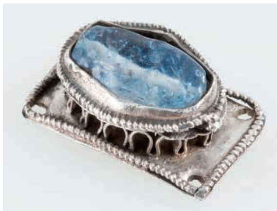
Fig. 5 Grande châsse de saint Maurice, Atelier de Saint-Maurice ?, vers 1150 et vers 1225-1230 (montage). Détail droite de la face D.