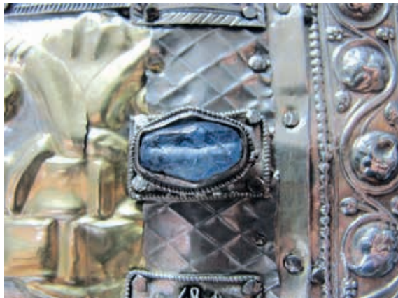
Fig. 4 Grande châsse de saint Maurice, Atelier de Saint-Maurice ?, vers 1150 et vers 1225-1230 (montage). Détail : saphir (après nettoyage).