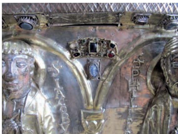
Fig. 6 Grande châsse de saint Maurice, Atelier de Saint-Maurice ?, vers 1150 et vers 1225-1230 (montage). Détail : saphir (après nettoyage).