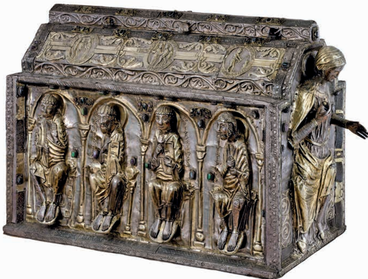
Fig. 1 Grande châsse de saint Maurice, Atelier de Saint-Maurice ?, vers 1150 et vers 1225-1230 (montage). Face B (Trésor de l'Abbaye de Saint-Maurice, inv. 2). H : 58,2 cm ; L : 80 cm ; l : 35,5 cm.

Imiter, contrefaire, c'est donc tromper les sens, ou tromper tout court : « ne tiens pas pour bonne toute belle pomme », conclut Alain de Lille. Si