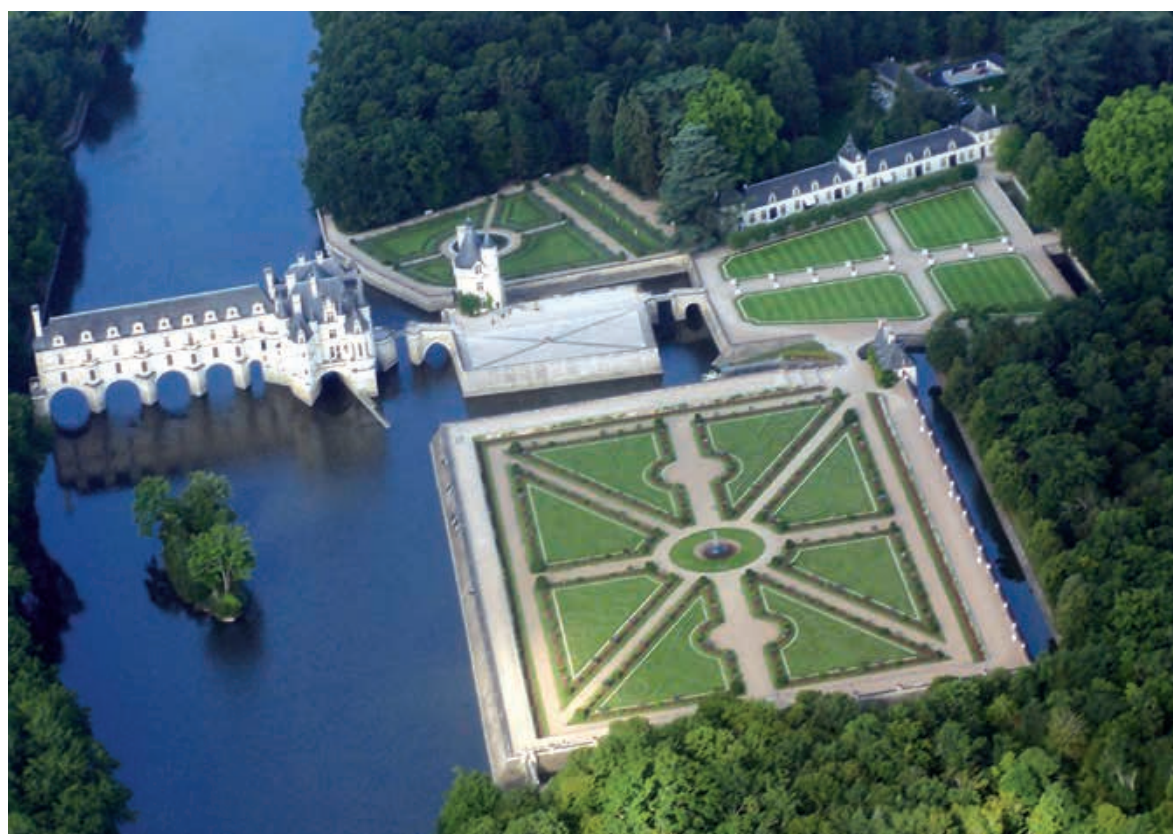
Fig. 1 Vue aérienne du château de Chenonceau avec ses jardins, 2007.

métiers du bâtiment furent longtemps peu accessibles aux femmes du fait des entraves sociales qui jugulaient leurs existences. Mais un nouveau regard porté sur les sources, même les plus connues, fait progressivement apparaître une nouvelle réalité. À l'occasion du colloque de 2022, le simple et rapide récolement de quelques connaissances existantes sur l'architecture française auquel nous nous sommes livré permet de dégager quelques thématiques et d'identifier quelques formes de leur intervention dans la réalisation du patrimoine bâti.