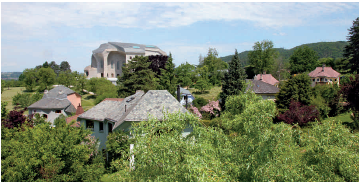
Oben: die kubische, strenge Ostseite des Goetheanums. Im Vordergrund der Gemüse- und Schnittblumengarten. Dahinter die Schreinerei. Rechts im Bild der Kamin des Heizhauses. Mitte: plastisch geformte Dächer der Kolonistenhäuser. Die Gebäude selbst verschwinden im dichten Grün der Parklandschaft. Unten: ökologische Bewirtschaftung der Wiesen rund um das Goetheanum. Fotos Michael Leuenberger

Bei der Gestaltung des Geländes wurden und werden heute noch zwei Grundprinzipien befolgt: Einerseits wird das Gelände als ganzheitlicher Organismus gesehen, in dem ein jeder Teil, vom Wegstein an der Westallee über die Parkbank des Rondells bis zum Hauptbau, in Beziehung zum andern und wiederum zum übergeordneten Ganzen steht, wobei sich die Teile je nach Lage und Funktion verwandeln (metamorphosieren). Andererseits wurden die Qualitäten des jeweiligen Ortes gesteigert zum Ausdruck gebracht, indem sie gezielt durch landschaftliche oder architektonische Eingriffe oder Elemente verstärkt wurden. 23 Der Idee der Ganzheit, der Biodiversität als Vielfalt von Lebensräumen, Arten und Genen ist auch die Bepflanzung des Geländes um das Goetheanum herum verpflichtet, die mit gelenkten Pflanzengesellschaften arbeitet und als Kreislaufwirtschaft angelegt ist. Gepflanzt werden Gemüse, Schnittblumen, Heil- und Färbepflanzen, Stauden