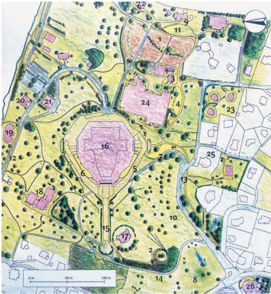
Plan des Gartenparks am Goetheanum. 1 Gemüse- und Schnittblumengarten, 2 Felsli, 4 Heilkräuter- und Färberpflanzengarten, 11 Duftkräutergarten, 14 Felsliweg, 15 Westallee, 17 Haus Duldeck.

und Obstbäume, wobei die Wahl der Pflanzen von den standortspezifischen Möglichkeiten bestimmt wird. Alle Garten- und Gemüseabfälle, Holz und Grasschnitt werden kompostiert und damit in einen Düngerkreislauf überführt.