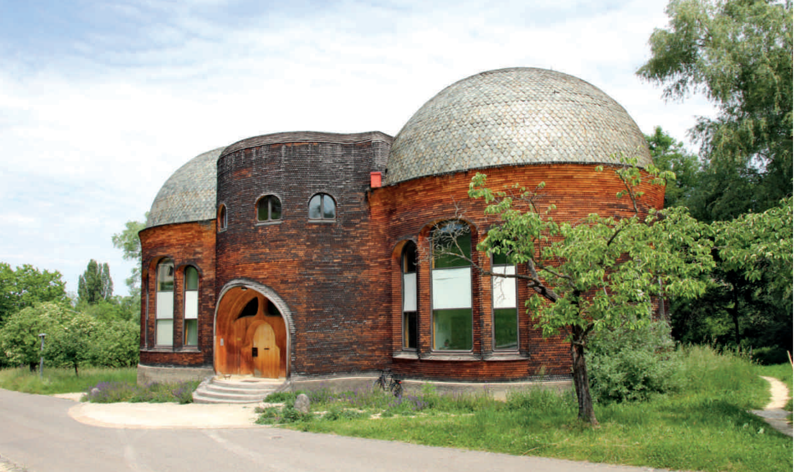
Glashaus (Rudolf Steiner, 1914). Der Holzbau mit seinen beiden schiefergedeckten Kuppeln erinnert in Formensprache und Materialität an das erste Goetheanum von 1913.

Anfang des 20. Jahrhunderts vor dem Hintergrund von Desintegration, Industrialisierung und Verstädterung mit der Idee einer ganzheitlichen und nachhaltigen Betrachtung der Welt mit all ihren Subsystemen ebenfalls eine kulturelle Revolution auslösen wollen. Auch wenn ihr das nur teilweise gelungen ist, so hat sie dennoch unser Denken in vielen Bereichen massgeblich geprägt. Die Rede ist hier von der anthroposophischen Bewegung und dem aus der Anthroposophie entwickelten organisch-dynamischen «Stil», wie ihn Rudolf Steiner (1861–1925), Begründer der Anthroposophie – ein philosophisch-wissenschaftlich fundierter, spiritueller Erkenntnisweg – und Vorreiter u.a. auf dem Gebiet der alternativen Wirtschaftsformen oder der biologisch-dynamischen Landwirtschaft, in über 60 Vorträgen beschrieben hat. 7 Seine Idee einer organisch-lebendigen oder «bewegten Architektur» im Gegensatz zur nichtorganischen, also einer statisch-abstrakten Betrachtungsweise von Architektur, hat mit dem Goetheanum nicht nur eines der bedeutendsten Gebäude des 20. Jahrhunderts hervorgebracht, sondern auch zum Bau einer Lebens- und Arbeitsgemeinschaft geführt. Diese Anthroposophen-Kolonie 8 auf dem Goetheanumhügel besteht, wenn auch in veränderter Form, noch heute, was sie einzigartig unter den Künstlerkolonien macht, die vom Ende des 19. Jahrhunderts bis zum Beginn des Ersten Weltkriegs Hochkonjunktur hatten.