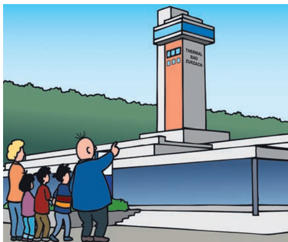
Papa Moll besucht das Thermalbad Zurzach: «Oben ist es speziell, lässt uns dort zu Mittag essen, das bleibt sicher unvergessen!» Illustration von Rolf Meier aus dem Buch Papa Moll geht baden , 2012.