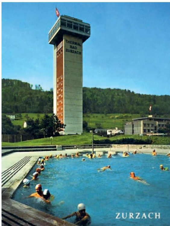
Unverkennbares Merkzeichen: Freibad und Turm.