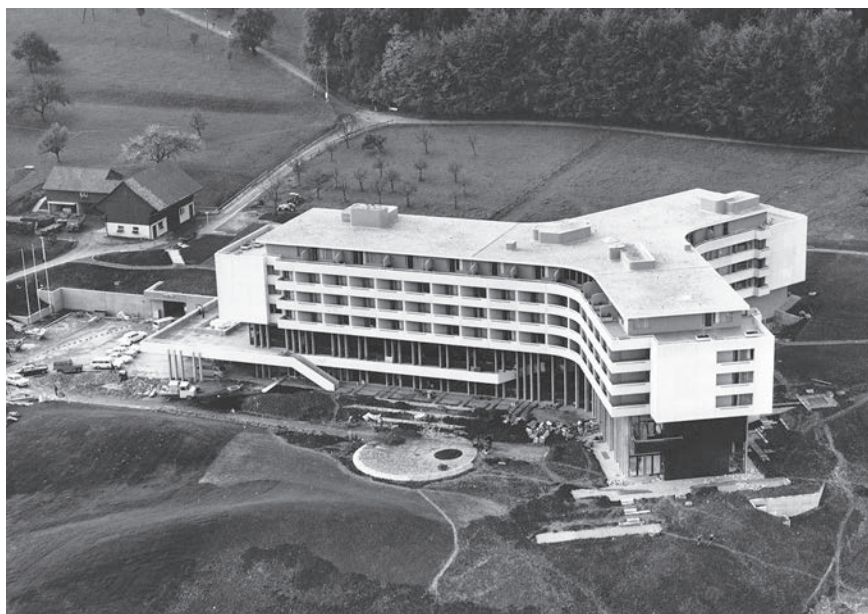
Hotel Atlantis kurz vor Bauende in einer Luftaufnahme.