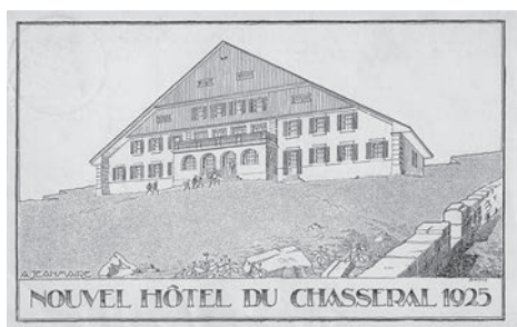
Fig. 1 et 2 L'Hôtel du Chasseral (ici avant les lourdes transformations des années 1970) proposait une architecture Heimatstil typique et se présentait comme un refuge pour les amoureux de la montagne.

Si un premier établissement au vocabulaire historiciste s'élève déjà depuis 1880 sur ce sommet du Jura (fig. 3), l'histoire de l'Hôtel du Chasseral bascule véritablement dans la nuit du 29 mars