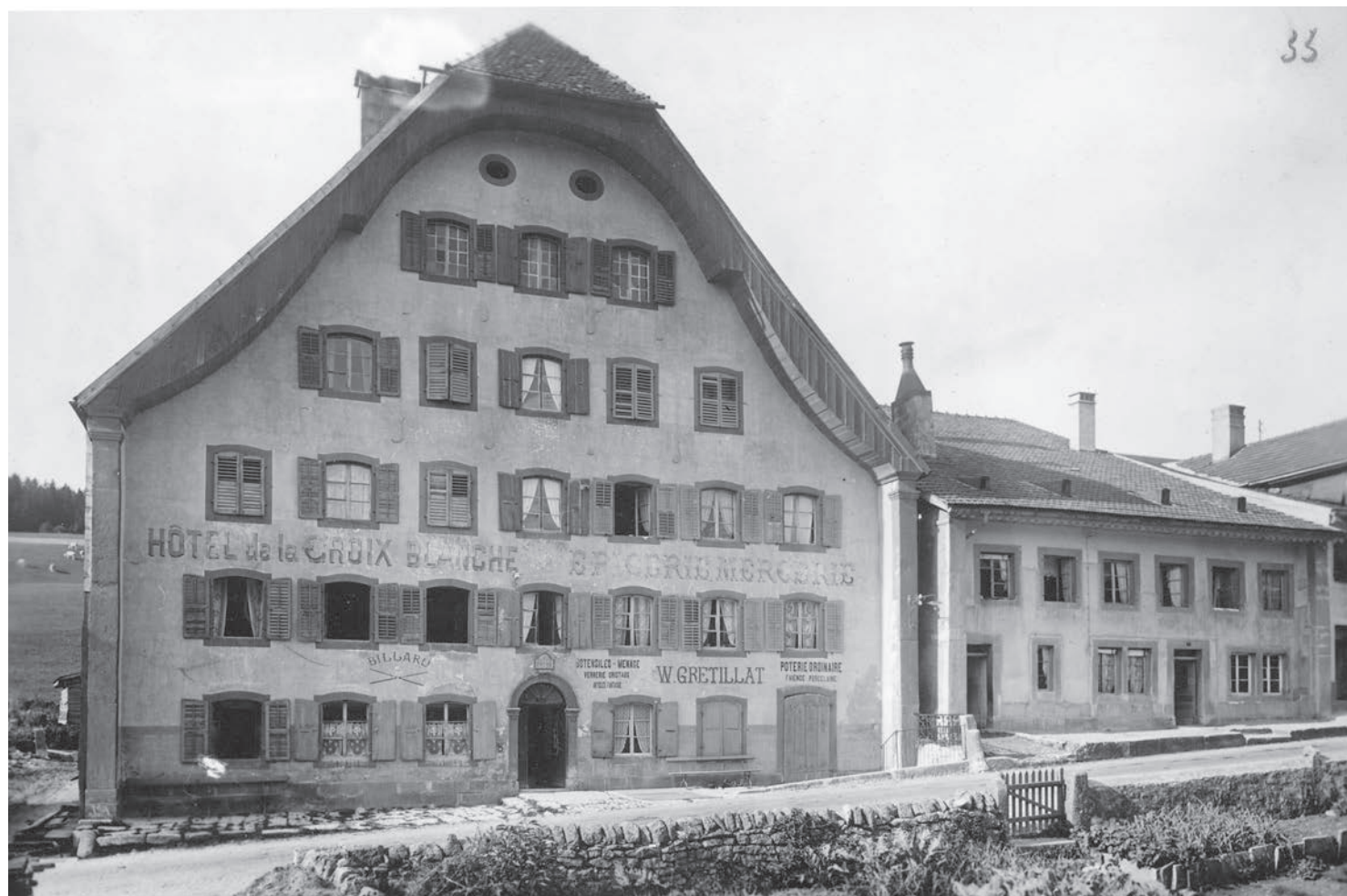
Fig. 9 Les nombreuses inscriptions figurant encore sur la façade dans les années 1930 témoignent des activités multiples que devait abriter l'Hôtel de la Croix-Blanche de La Sagne.

Situé dans la partie la plus dense du village-rue de La Sagne, l'hôtel s'inscrit dans un contexte de prospérité particulière. Tout au long du XVIII e siècle et jusqu'aux années 1840, la localité connaît