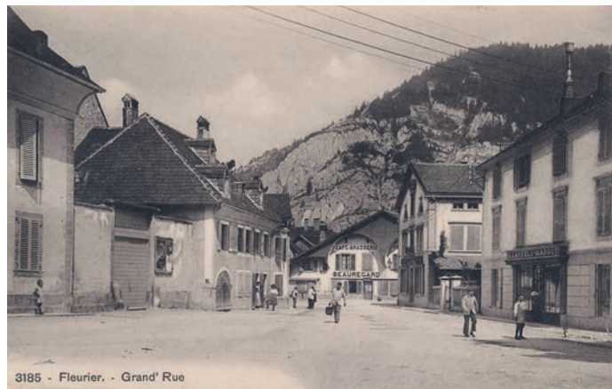
Fig. 5 Aujourd'hui la bâtisse située Grand-Rue 10 à Fleurier est propriété de l'Association du Musée régional du Val-de-Travers et accueille des expositions d'artistes locaux et des événements culturels.