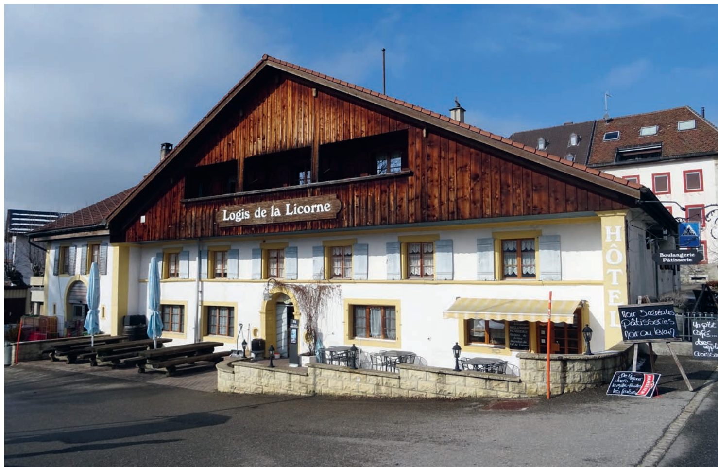
Fig. 7 Le Logis de la Licorne à La Ferrière, établi au centre du village, a dès sa fondation en 1688 mêlé différentes activités allant de la médecine à l'agriculture en passant par le commerce et l'hôtellerie. Photo Nicolas Jacot, 2025