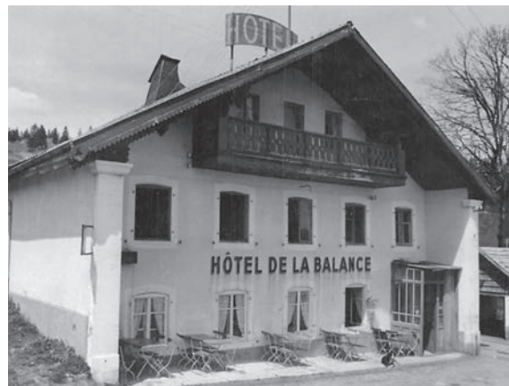
Fig. 10 et 11 L'attestation des deux établissements à La Tourne (à gauche) et à la Vue-des-Alpes (à droite) dès 1810 s'inscrit dans la logique du développement routier de l'actuel canton de Neuchâtel.

en effet une amélioration générale des conditions de vie, notamment grâce à l'essor de la production de dentelle à domicile 22 .