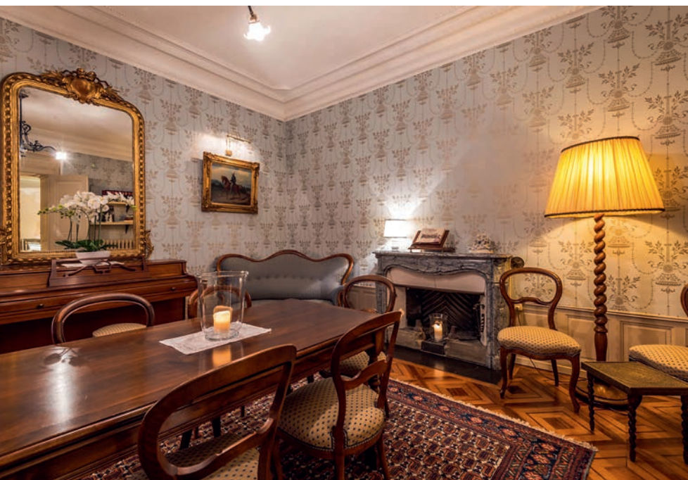
Abb. 7a Das Weinbauernhaus des Jean-François Masson, erbaut 1829 in Veytaux bei Montreux VD, wird 1855 zur «Pension Masson» ausgebaut. Lithographie Baumann, um 1860.