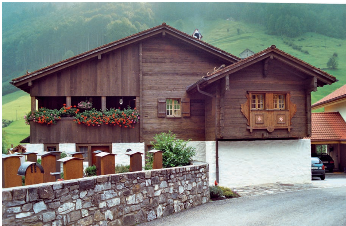
Abb. 1 Pfarrhaus Isenthal UR mit separatem Zimmer für den Bischof, hinzugefügt anlässlich seines Visitationsbesuches um 1684.

einem durchaus bescheidenen Wohnhaus, das sich von den übrigen Bauten im Dorf kaum abhob. Insofern kann man das Pfarrhaus durchaus als frühe Form von Bed and Breakfast betrachten. «Im Dorf Unterschächen [UR] betraten wir das Pfarrhaus. Der Geistliche des Ortes bewirthete die Reisenden», steht im Helvetischen Calender von 1797. Bei einem aussergewöhnlichen Ereignis, etwa dem Visitationsbesuch des Bischofs von Chur, leisteten sich Pfarrer und Dorfleute von