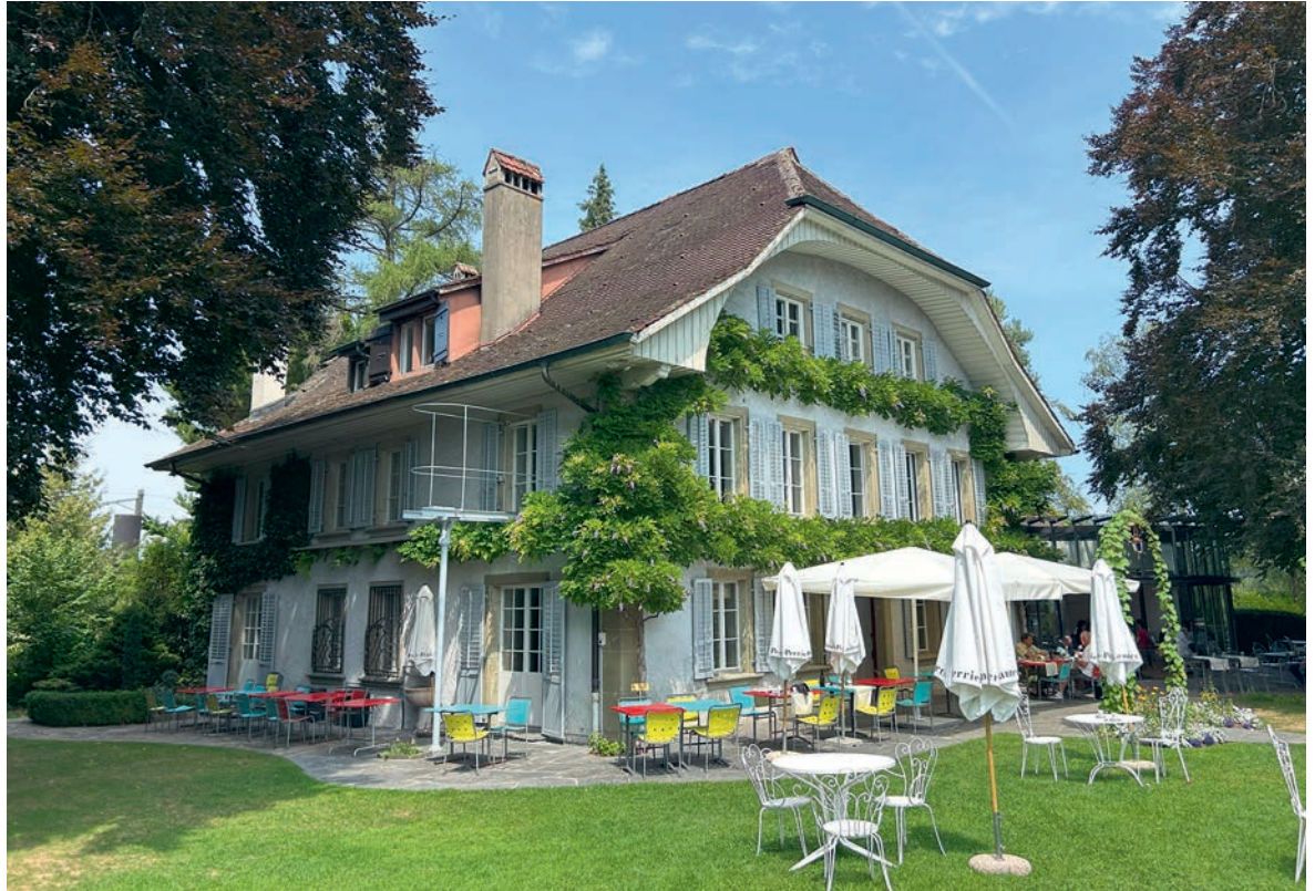
Abb. 10 Das im 17. Jahrhundert als Sommersitz für die Familie Boccard ausserhalb der Stadt Freiburg erbaute Wohnhaus wird seit 1977 als Hotel-Restaurant Auberger aux 4 vents betrieben.

Abgesehen von den beschriebenen Beispielen einer «Verwandlung» von Bauernhäusern zu «Hotels» standen den Hotelgästen in einigen Regionen aber auch niederschwellige Angebote zur Verfügung. Ein interessantes Beispiel dafür sind sogenannte Kaffeewirtschaften in Engelberg OW, kleine Pavillons neben Bauernhäusern, wo Bäuerinnen den Touristen im Sommer mit einem Getränkeangebot aufwarteten. Mittels Spende konnte ein Kurgast einer Bauernfamilie zu ihrem eigenen Holzpavillon zum «Kaffeekochen für Fremde» verhelfen. 12