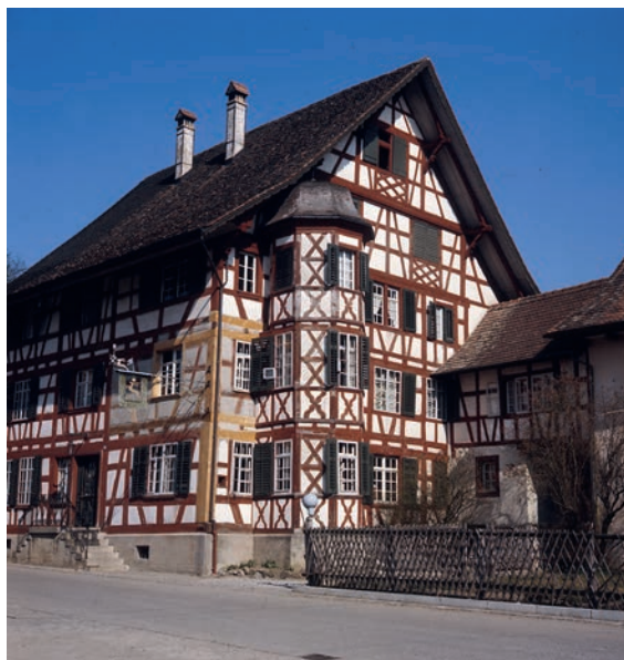
Abb. 8 Das Landgut mit Wohnhaus, Scheune und Trotte des Stadtzürchers Johannes Wehrli, erbaut 1684–86, wird im 19. Jahrhundert Gasthaus, im 20. Jahrhundert zum Hotel Hirschen umgenutzt. Foto Ballenberg, Freilichtmuseum der Schweiz. Bauernhausforschung, 1967

Nach einem Brand 1908 musste der hintere Teil des Hauses neu aufgebaut werden. Damals diente das Haus vorübergehend als Schule für die Kinder der am Bau der Lötschbergbahn beteiligten Arbeiter aus Italien. Nach Abschluss der Bauarbeiten wurde das «Ruedihus» als Pension betrieben. 1990 kam es in den Besitz der Familie Maeder, und im Jahr 2000 erhielt das «Ruedihus» von ICOMOS eine besondere Auszeichnung für die umsichtige Restaurierung des bedeutenden Landgasthofs (Abb. 9). 10