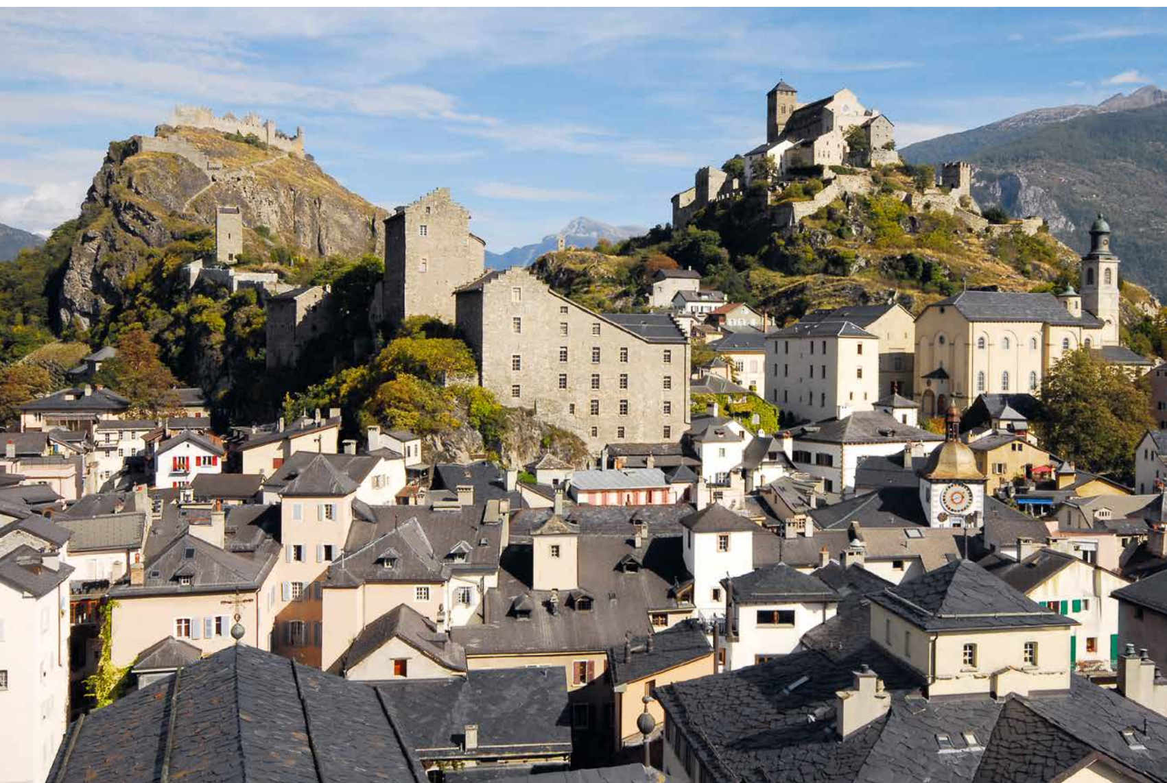
Fig. 1 La vieille ville de Sion dominée par les collines de Valère, à droite, et de Tourbillon, à gauche. Au centre le complexe du Vidomnat, surmonté de la Majorie et, à gauche, la tour des Chiens. En contrebas de Valère, l'église des Jésuites. © Musées cantonaux du Valais, Sion. Photo Jean-Albert Margelisch, 2007

colline. Aucun vestige ne permet de savoir si une construction antérieure s'y trouvait. On ignore également si des habitations sont immédiatement bâties. Les premières qui soient attestées remontent aux environs de 1200. Ne suivant pas une règle comme leurs homologues de l'abbaye de Saint-Maurice ou de l'hospice du Grand-Saint-Bernard, chaque chanoine possède sa propre maison. Celles-ci sont positionnées autour de l'église, de manière indépendante. Elles sont simplement formées d'un étage (parfois deux) sur cave, couvert par une toiture posée sur le crénelage sommital.