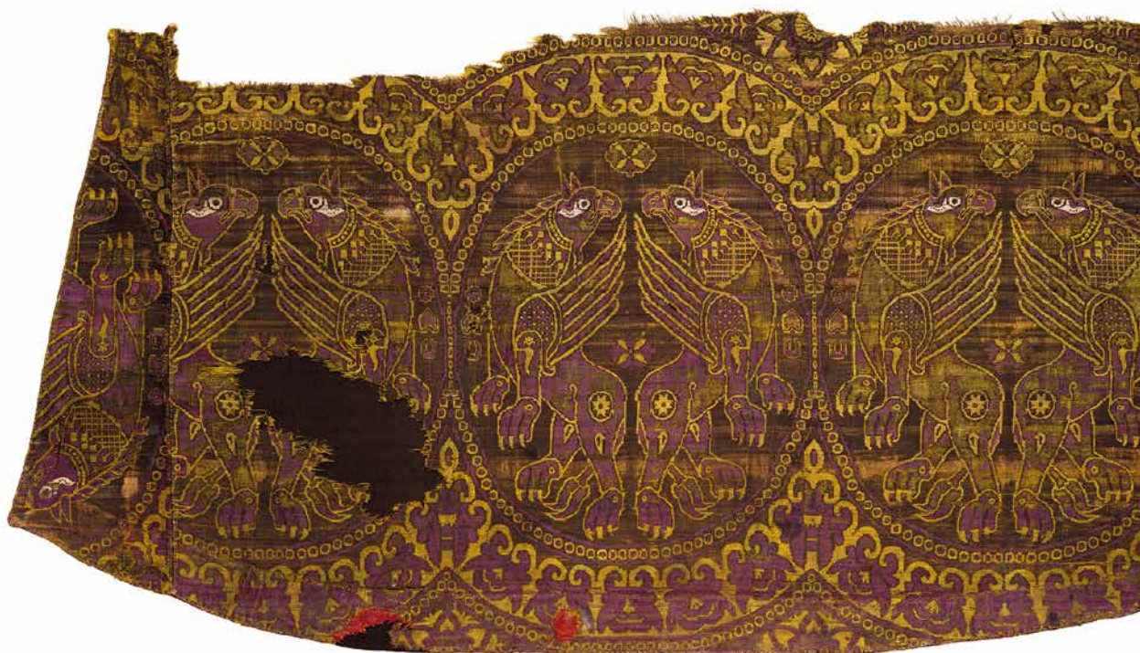
Fig. 9 Détail d'un fragment de dalmatique du XI e siècle, provenant probablement de la cour impériale de Constantinople et ayant servi d'enveloppe de reliques.