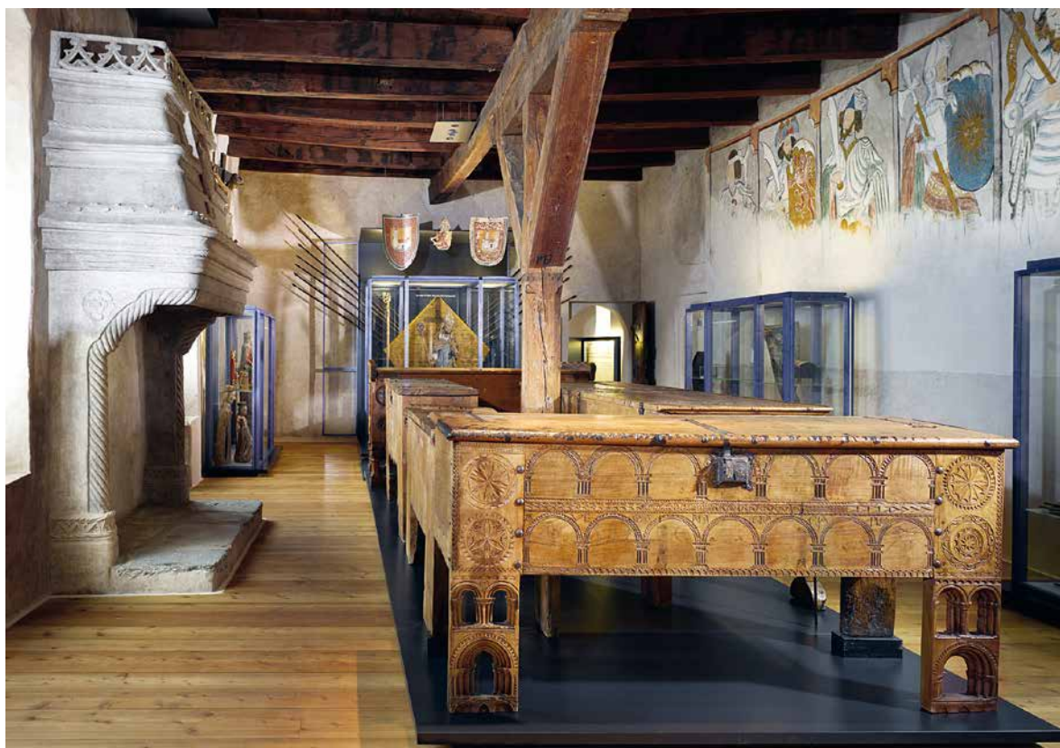
Fig. 5 Les coffres liturgiques du XIII e siècle exposés dans l'une des grandes salles de réunion du Chapitre, ornée des Neuf Preux peints vers 1470 sur la paroi de droite.