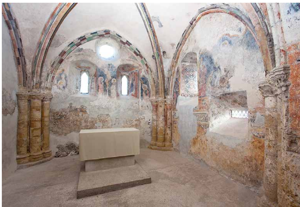
Fig. 12 Le chœur de la chapelle et son cycle pictural du XIV e siècle. Photo Robert Hofer, vers 2000