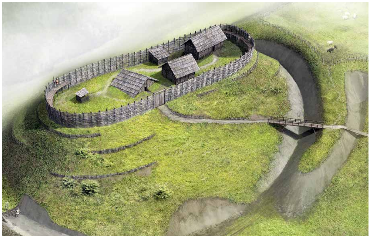
Rekonstruktion der frühen Burg Salbüel LU.

Erstens durch seine Lage. 3 Der Herrnsitz, im Frühmittelalter im Zentrum des Siedlungsareals, wurde von den Dörfern weg und in die Höhe verlegt. Das geschah auch aus Sicherheitsüberlegungen – viel entscheidender aber war der Symbolwert. Denn durch die landschaftsbeherrschende Lage wirkten bereits diese ersten Burgen als weithin sichtbare Monumente adliger Macht. Die Absonderung von den bäuerlichen Untertanen war ein weiteres, durchaus beabsichtigtes Element des neuen adligen Selbstverständnisses.