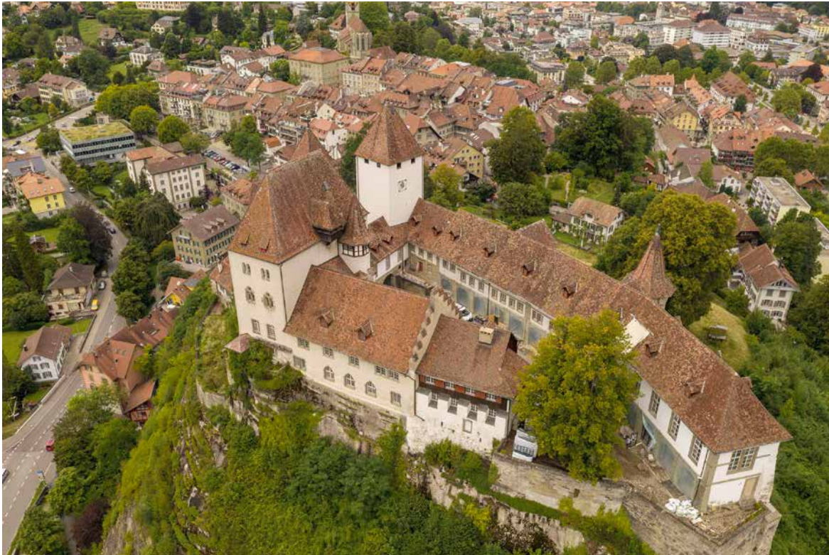
Schloss Burgdorf BE mit Bergfried, Palas und Halle.