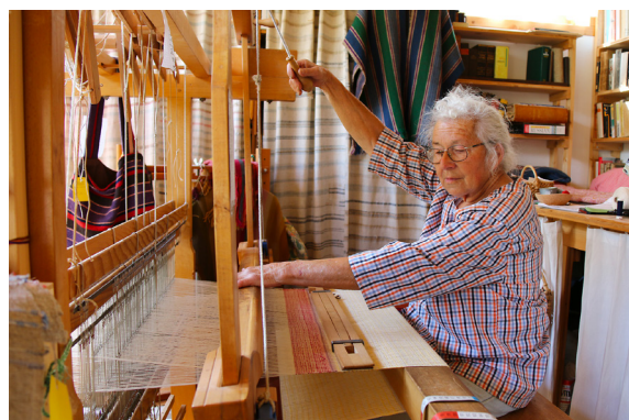
Sciarpe in lino 100% per un tocco di esclusività