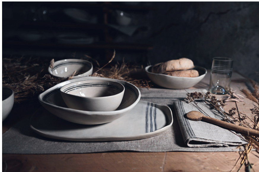
Sottopiatto e tovagliolo. Progetto Casa Tomé

Un ultimo punto sul quale si intende puntare è la formazione: essa risulta di essenziale importanza per garantire la trasmissione della tradizione tessile alle nuove generazioni. Sotto la guida di MUVA è stato creato un gruppo di lavoro che ha come obiettivo la creazione di un percorso che permetterà di scoprire l'intero processo produttivo, dalla raccolta della lana alla creazione del tessuto finito. ●