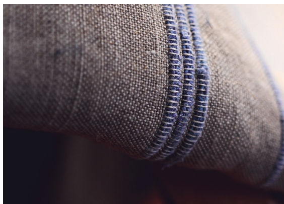
Cuscini in lana e cotone