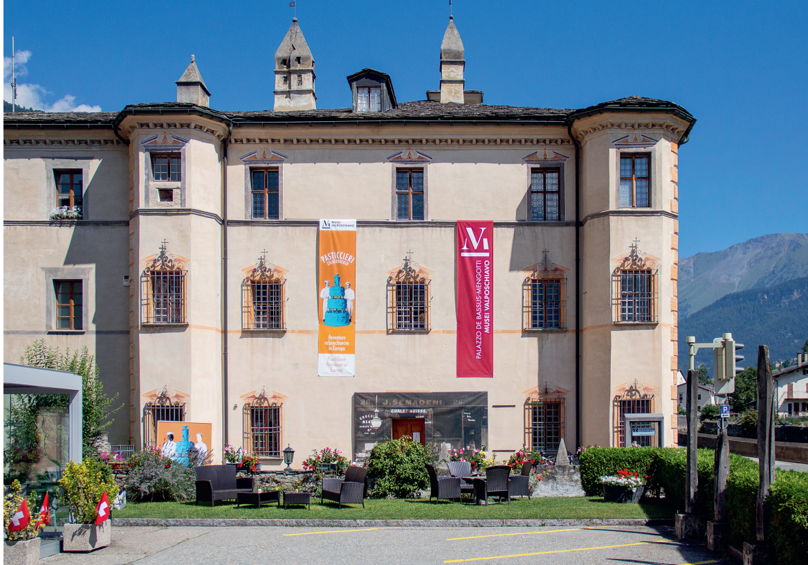
La Tessitura si trova al piano terra del Palazzo De Bassus-Mengotti