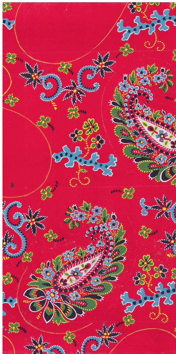
Abb. 10 Exportetikette der Firma Blumer für CHÂLES CACHEMIRE. Für den Nahen Osten, Ägypten, Tunis, 18 × 9 cm. © Schweizerisches Nationalmuseum, LM 89827.9

Der Handdruck mit Modeln war im 19. Jahrhundert in Europa eigentlich veraltet. Druckverfahren mit Walzen und Schablonen waren effizienter. Für den weltweiten Erfolg der Glarner Textilien war die Technik des Handdrucks aber von grosser Bedeutung. Damit konnten angepasste Einzeltücher hergestellt und auf Kundenwünsche eingegangen werden. Während beim Bedrucken eines Mouchoirs die Rouleaux-Druckmaschine bei drei bis vier Farben an ihre technische Grenze stiess, waren sechs bis acht Farben im Handdruck keine Besonderheit. Die bunten Entwürfe von Rudolf Hotz zeugen von den Vorteilen dieser manuellen Technik und der Suche des