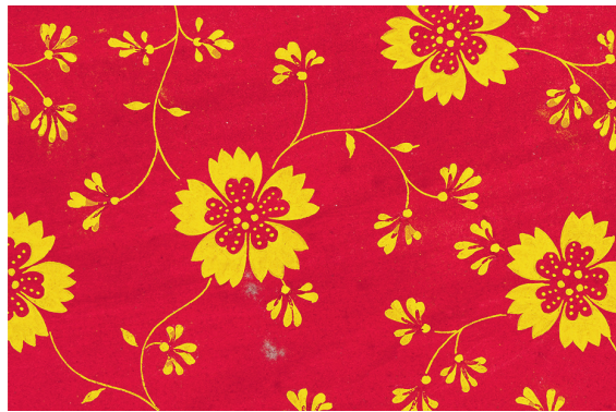
Abb. 5 Doppelseite mit Stoffmuster «Rabenfabrik» Netstal, Uni-Türkischrot mit Handdruck Tafel-Blauholzschwarz, um 1820. Aus Band XI der Druckmuster-Sammlung A. Jenny-Trümpy (1855–1941).

Ab 1832 lebte Hotz in Zürich, bevor er 1840 in die Gemeinde Enge zog und das Haus an der Brandchenkestrasse bis zu seinem Tod 1893 bewohnte. In diesem Haus war er auch als Weinschenk eingetragen. Die datierten Entwürfe weisen auf die Jahre, als Rudolf Hotz aus dem Glarnerland bereits wieder