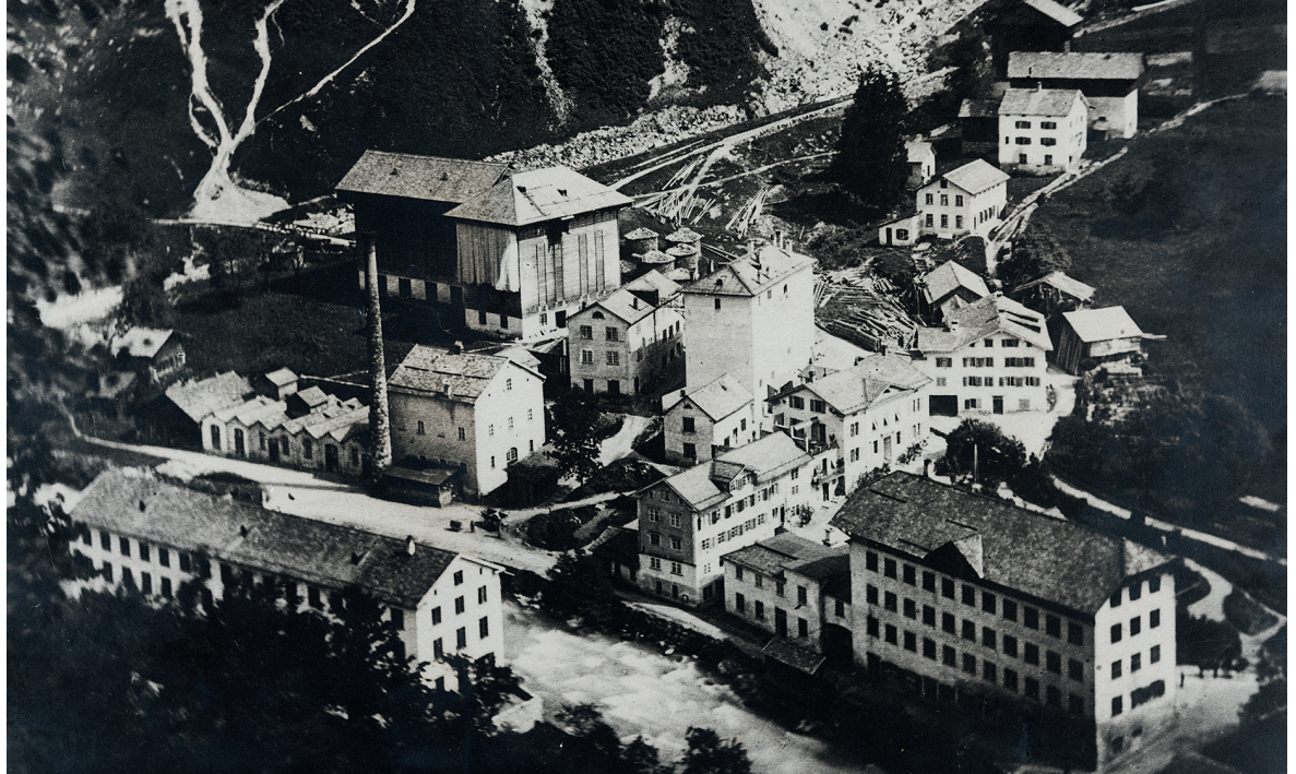
Abb. 8 Fabrikareal Tschudi und Co. mit Hänggiturm, wohl Ende 19. Jahrhundert, Schwanden.

zurück in Zürich war. Es kann vermutet werden, dass Hotz als freier Zeichner arbeitete und auf eigene Rechnung an Kattendruckereien verkaufte.