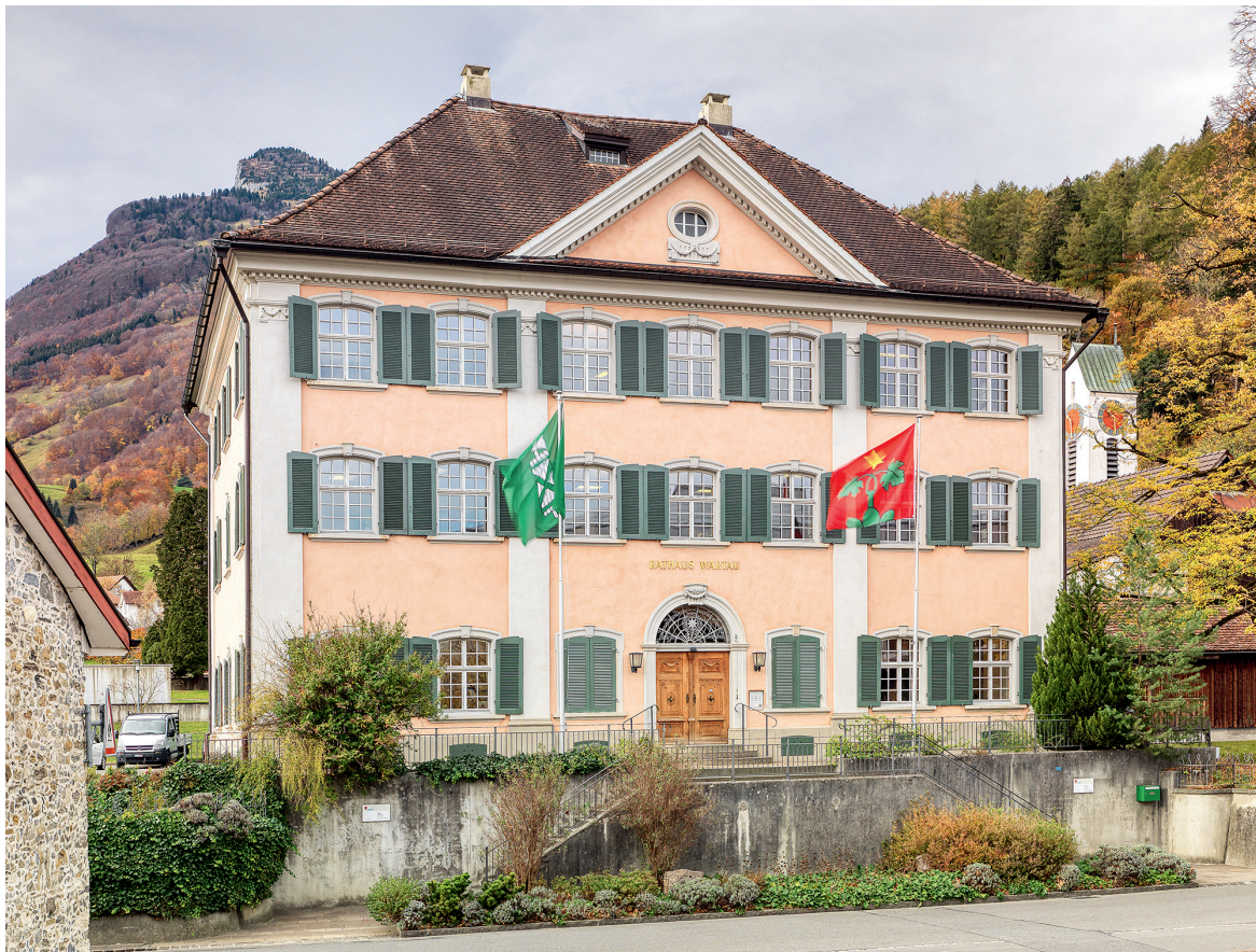
Azmoos, das «Rote Haus», seit 1918 Rathaus von Azmoos, wurde 1802–1804 leicht ausserhalb des alten Dorfes an erhöhter Lage über der heutigen Poststrasse erbaut. Seine dreiteilige Fassade mit Pilastern und Frontispiz macht es zu einem der stattlichsten barocken Häuser des St. Galler Rheintals.

das erste Gebäude des Kantons und der erste Profanbau der Ostschweiz mit einer vollständig aus Sandsteinquadern gefügten Fassade. Mit dem frontispizbekrönten Mittelrisalit war das Haus zudem in seiner klassizistischen Ausprägung der Zeit weit voraus. Die Annahme, dass die Idee oder Vorlage dazu aus Lyon stammt, ist naheliegend. Mit dem Eintritt in den auch hier gewölbten Korridor des Erdgeschosses findet man sich in einer anderen Welt wieder, der überschwängliche Rokokostuck verleiht dem Raum fast etwas Grottenartiges. Die reiche Stuckdekoration zieht sich durch das ganze Haus, sie wird ergänzt durch Nussbaumtüren und -täfer. Im zweiten Obergeschoss sind zwei Steckborner Fayence-Prunköfen erhalten geblieben.