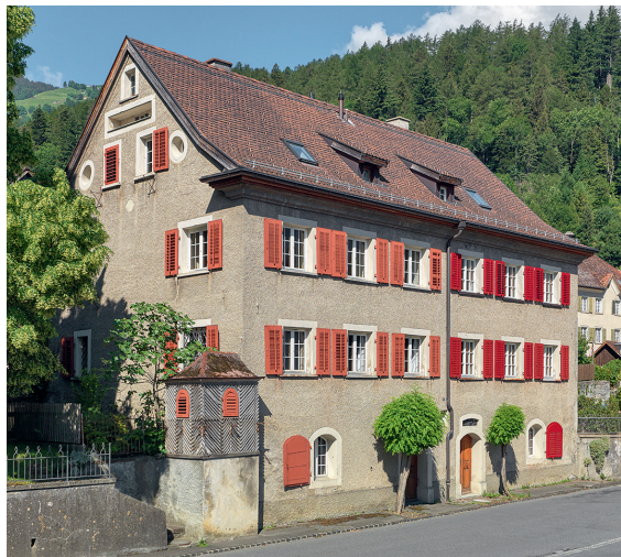
Azmoos. Das in der heutigen Form um 1716 erbaute Graue Haus wird in der mündlichen Überlieferung als Stammhaus der Sulzer bezeichnet.

Die Steinbauten in Azmoos – Kirchweg 7/9 (Graues Haus, 1716); Poststrasse 56/58 (Gasthaus Traube/Haus beim Brännili, 1711); Kirchweg 2 (1698); Kirchweg 4 (um 1700); Poststrasse 60/62 (1764) – sind ausser Kirchweg 4 alles Doppelhäuser. 27 Typisch sind die gegen die Hausmitte nebeneinanderliegenden Eingänge, bei den ältesten sind diese rundbogig. Dahinter liegen gewölbte Gänge zu den Treppenhäusern sowie seitlich Gewölbekeller. Bei den zweiläufigen Treppenhäusern ist jeder Lauf mit einem schmalen Tonnengewölbe überfangen. Während die gewölbten Erdgeschosse und Untergeschosse als Lager dienten, zeigen die Räume im ersten Obergeschoss repräsentati-