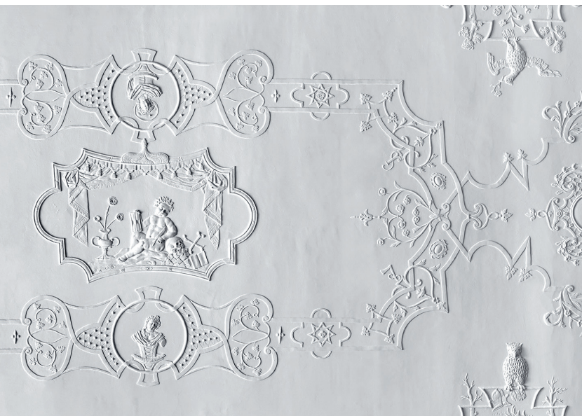
Herisau, Wetterhaus, Vestibül vor dem Festsaal, Wessobrunner Stuckdecke 1737. Der Mensch (Büsten von Mann und Frau) im immerwährenden Kreislauf der Jahreszeiten (Seitenmotive mit Vögeln) ist selbst der Vergänglichkeit unterworfen (Putto zwischen Blumen und Totenschädel).