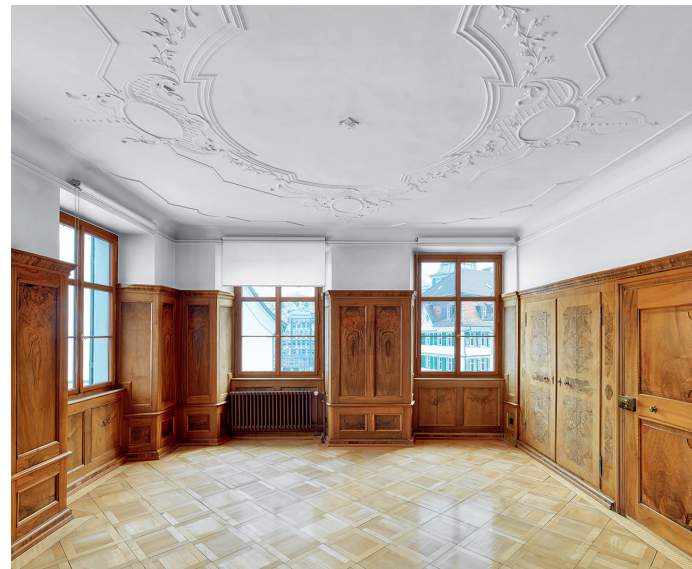
Trogen, Gemeindehaus. Das vornehmste Zimmer des Zellweger-Wetter-Hauses liegt im zweiten Obergeschoss gegen den Platz. Neben dem Nussbaumtäfer und dem polychromen Steckborner Ofen befindet sich hier die «politischste» Stuckdecke mit Allegorie der Freiheit, Rütli Schwur, Gesslerhut und Apfelschuss.