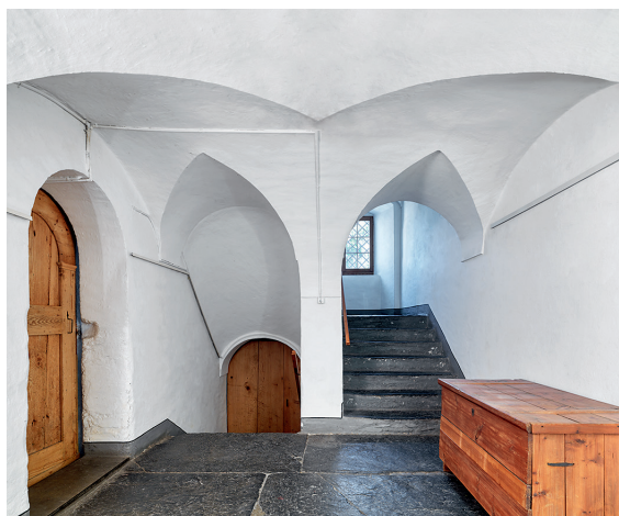
Azmoos, Eingang «Haus beim Brännili» mit Melser Verrucanoplatzen und gewölbtem Treppenhaus. Foto Jürg Zürcher, 2019