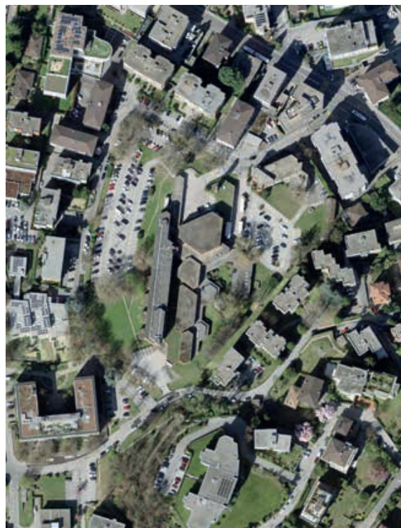
Veduta zenitale dell'area dello Studio Radio, oggi e una volta realizzata la Città della Musica (Architecture Club, 2025)