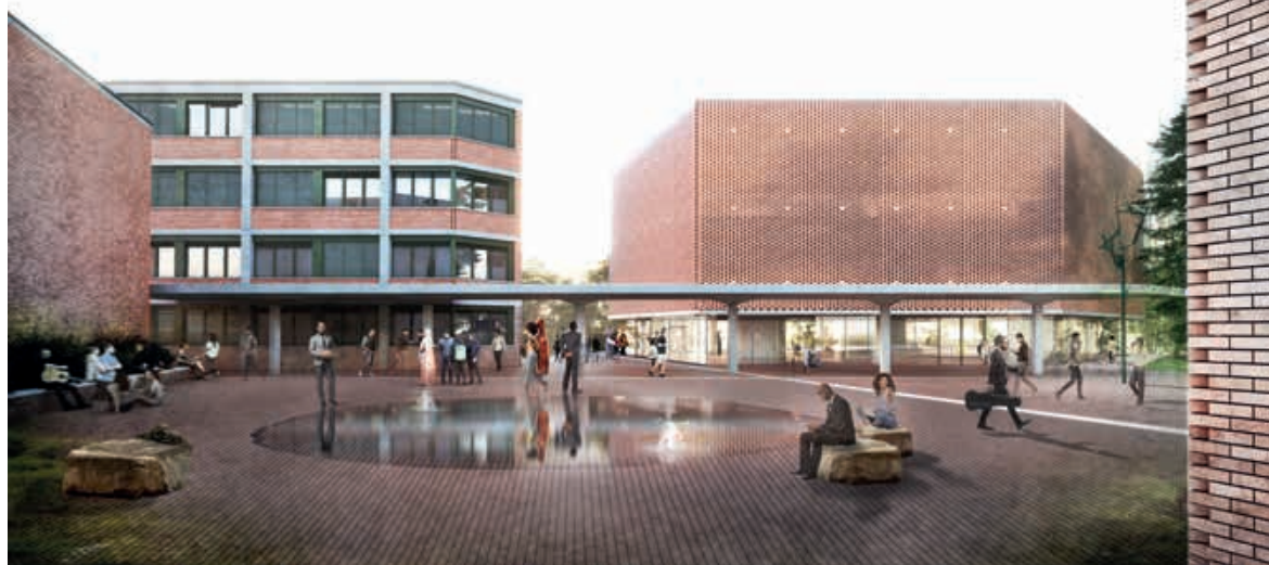
L'area di ingresso alla Città della Musica nella sua attuale configurazione (Architecture Club, 2025)

separato, a livello del piano terreno, da un generoso passaggio che funge anche da area d'ingresso), troviamo il volume destinato alle aule didattiche di dimensioni maggiori. L'edificio preesistente veniva modificato (oltre che nella partizione interna dei corpi che ospitavano le sale di registrazione) soprattutto a livello del piano seminterrato con l'aggiunta, verso il giardino, di due avancorpi identici ai quattro preesistenti (una scelta fortunatamente emendata nel successivo sviluppo del progetto, grazie alla positiva interazione con l'Ufficio beni culturali del Cantone Ticino). La materializzazione dei nuovi volumi interpreta quella dello Studio Radio, attraverso l'uso di cortine traforate di mattoni di cotto e una composta eleganza che si potrebbe forse accostare a quella «orgogliosa modestia» in cui si era identificato Rino Tami. E pure convincente è il delicato equilibrio che gli autori del progetto per la Città della Musica riescono a instaurare tra gli spazi aperti e la «confederazione di volumi» che caratterizza lo Studio Radio e a cui i nuovi corpi si confrontano, dimostrando la validità e il potenziale del sistema ideato da Camenzind, Jäggi e Tami 16 .