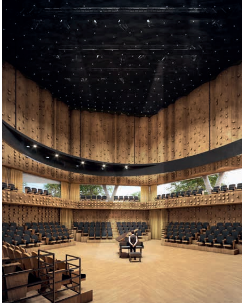
Architecture Club, Progetto per la Città della Musica a Lugano-Besso, prospettiva virtuale della sala concerti / prove nelle sue diverse configurazioni, stato attuale del progetto (Architecture Club, 2025)