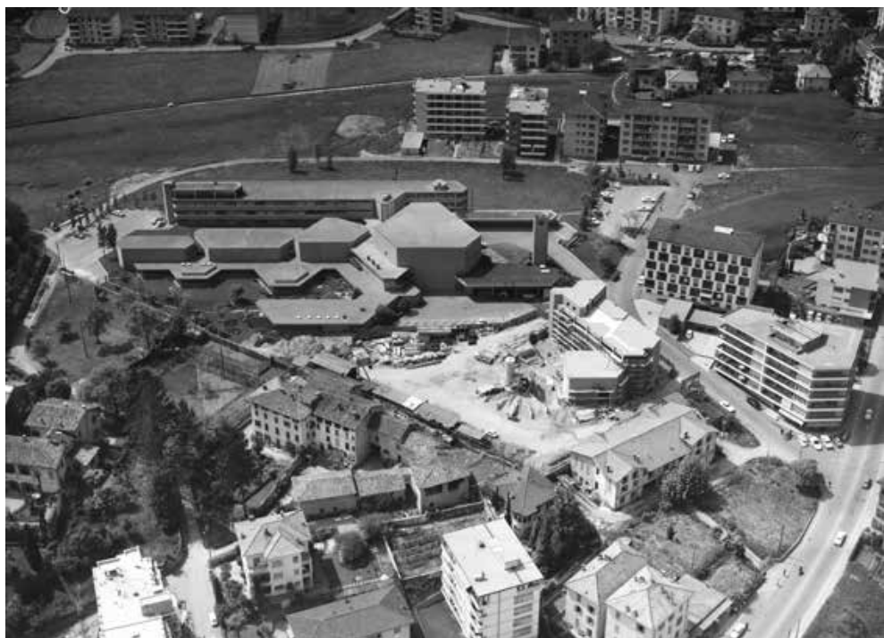
Veduta aerea dello Studio Radio e dell'edificio per la TSI in costruzione

Tra le vicende successive, due sono le decisioni che occorre qui rammentare. La prima è la scelta della Società svizzera di radiotelevisione (SSR) di trasferire progressivamente la produzione dei programmi radiofonici dallo Studio di Besso al complesso di Comano, inaugurato nel 1976 secondo il progetto di Augusto Jäggl come nuova sede della Televisione Svizzera Italiana. La seconda è