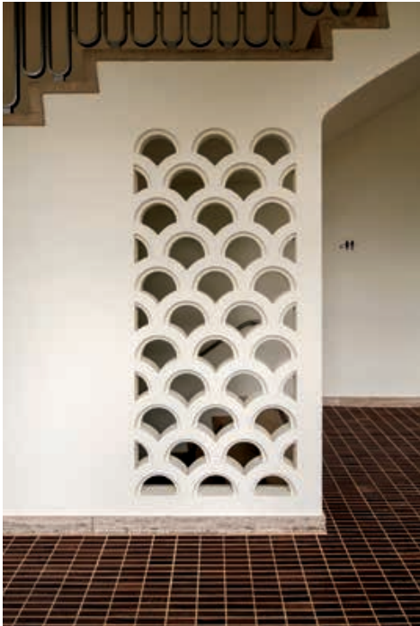
Schulanlage Brunnenhof, Wanddetail von 1939 in der Eingangs- und Wandel- halle, 2025.