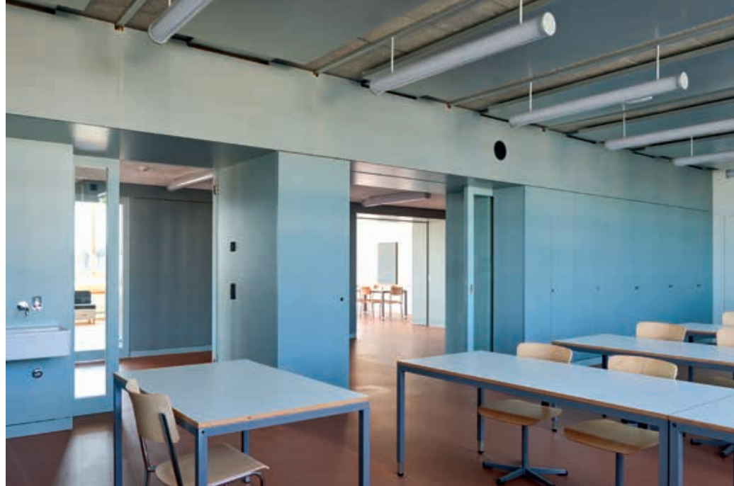
Spillmann Echsle Architekten, Lifteinbau im ursprünglichen Radio- trakt, 2025.