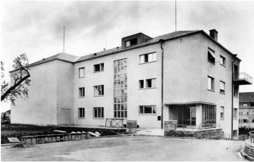
Radiostudio Zürich, 1932/33, Eingangsfrent.