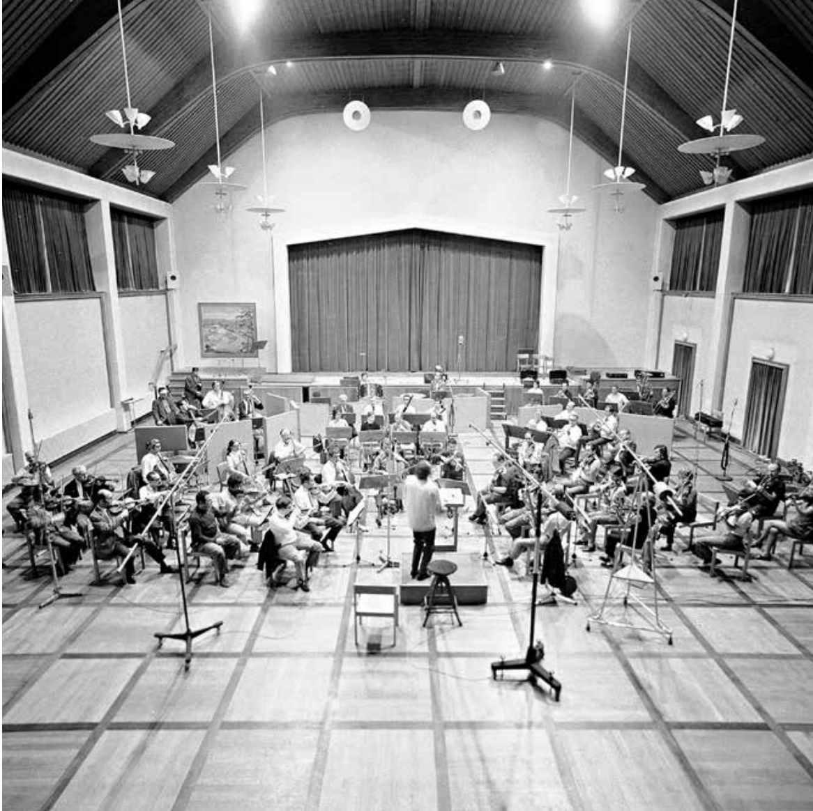
« Orchesterprobe im Studio 1. Ab dem Ende der 1950er Jahre fanden gewisse Sen- dungen des Radio-Orches- ters wieder vor Publikum statt.