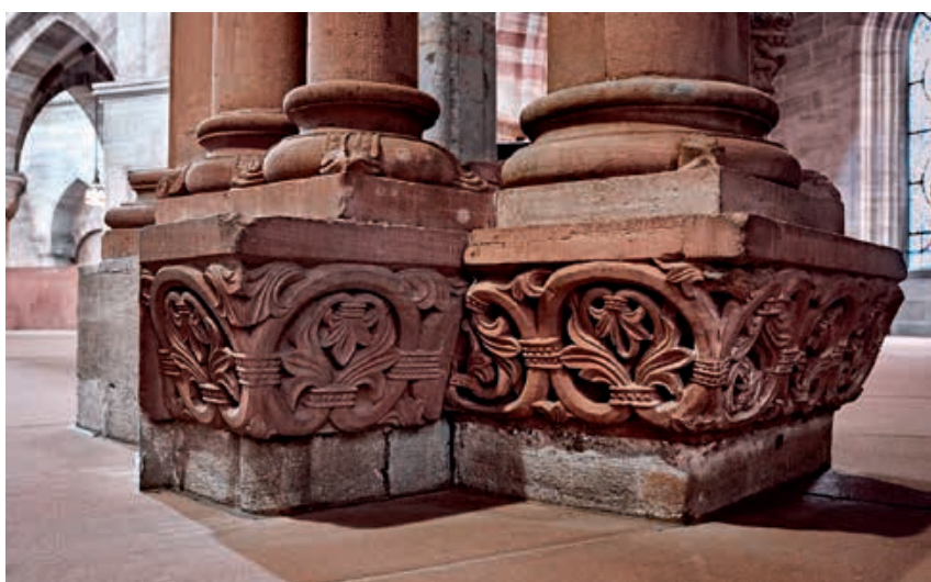
Abb. 8 Fries am Fusse des Chor Pfeilers (a). Links im Bild das Fragment des ursprünglichen Frieses und rechts zwei Spolien. Foto Dirk Weiss, 2019