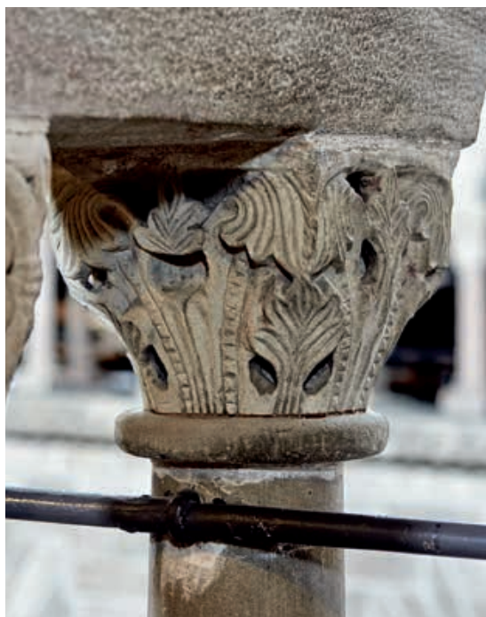
Abb. 9 Überarbeitetes Akanthuskapitell aus Kalkstein im zweiten Joch von Westen der nördlichen Langhauserempore des Basler Münsters.

Chor Pfeilers (b) sind Ersetzungen zu vermuten (Abb. 10). Die ganzen Natursteine samt Rankenfries wurden neu hergestellt. Im Übergang zum nächstfolgenden Friesabschnitt zeigt sich deutlich, wie das Ornament unterbrochen ist.