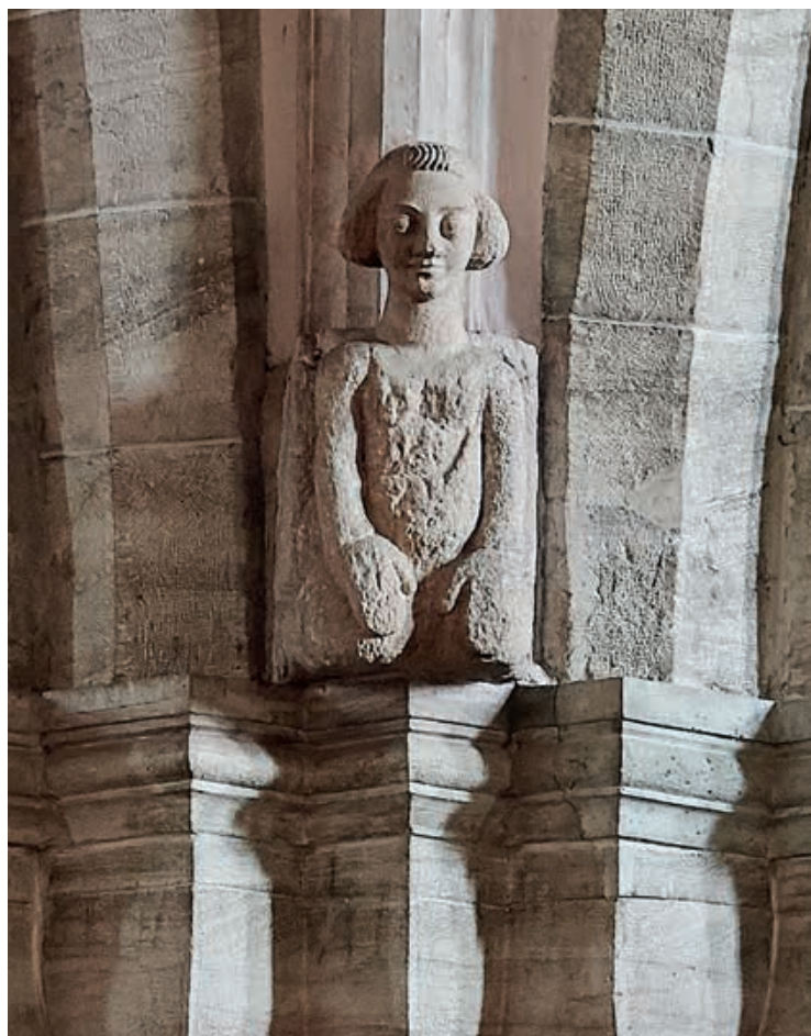
Abb. 6 Evangelistensymbol des Matthäus (Engel) am südwestlichen Vierungspfeiler. Die Skulptur wurde aus wiederverwendetem spätromanischem Torso und neu ergänztem Kopf zusammengefügt.

In den zwei Pflanzenkapitellen seitlich des Ritterkapitells am Chorpfeiler (c) sind Spolien zu vermuten, die mit gewisser Plausibilität nach dem Erdbeben hier ihren Platz fanden. Seitlich ans Ritterkapitell angrenzend, weichen sie in ihrer Materialität und der Aufstellung von den übrigen Kapitellen ab (vgl. Abb. 5). Der Schaftring mit Kapitellkörper und Abakus besteht nicht aus einem Werkstein, wie dies bei den übrigen Chorkapitellen anzutreffen ist. Zirka zwei Zentimeter des Kapitellfusses bestehen aus anderem Kalkstein als der darüber aufsetzende Kapitellkörper. Ein im Aufbau vergleichbares Pflanzenkapitell findet sich auf der nördlichen Langhausempore im zweiten Joch von Westen (Abb. 9). Der Abakus wurde abgeschlagen und der Schaftring aus einem anderen Stein gefertigt. Dieses Kapitell weist in der Verwendung von Kalkstein und in der Gestaltung der Akanthusblätter, die an verschiedenen Stellen à jour gearbeitet wurden, eine hohe stilistische Übereinstimmung mit einigen Pflanzenkapitellen an den Chorpfeilern auf. Vermutlich entstammen einige Kapitelle der Langhausempore und der Chorpfeiler demselben Bestand und wurden bei