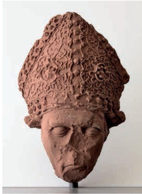
Abb. 11 Kopf der Liegefigur vom Tischgrab Bischof Hartmanns III. Münch von Münchenstein, († 1424).