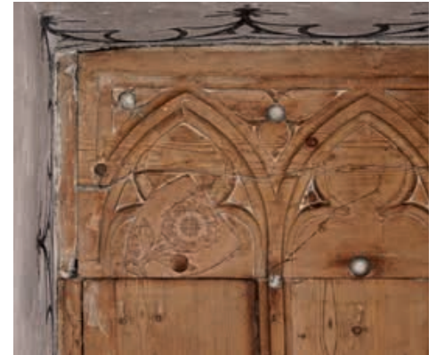
Abb. 12 Wappen der Familie Rot an der spätgotischen Leistendecke der Niklauskapelle, um 1480.

zum Thiergarten» gedeutet und auf Margaretha, die Stifterin des Erhardaltars, bezogen, doch kann dies nicht verifiziert werden. Auch ein Bezug zum Geschlecht der Berwart, von denen gleich zwei Angehörige in unmittelbarer Nachbarschaft zum betreffenden Wandbild bestattet liegen, lässt sich nicht herstellen, da das Berwart-Wappen keinen Bären, sondern eine blaue Lilie vor rot-weissem Hintergrund zeigt. 16 Leider ist auch für das Wandbild mit der Heiligenreihe an der Eingangswand die Auftraggeberschaft unklar; möglicherweise hatten die Auftraggeber einen besonderen Bezug zu diesen Heiligen und dokumentierten auf diese Weise, dass sie sich am Jüngsten Tag deren Fürbitte vor dem Höchsten Richter erhofften. Desgleichen ist auch der kniende Domherr am Kreuzesfuss als Sinnbild der Erlösungshoffnung zu verstehen.