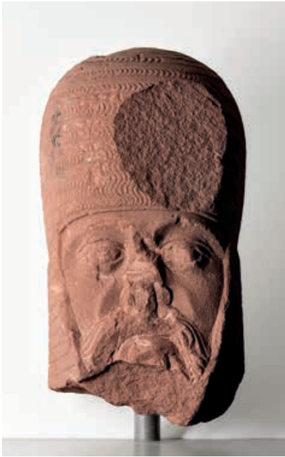
Abb. 10 Der 1947 in der Vermauerung einer Wandnische gefundene Kopf eines Ritters könnte vom Tischgrab Ottos II. Münch stammen, der 1318 den Dreikönigsaltar gestiftet hat. © Denkmalpflege Basel-Stadt, Foto Peter Schulthess, 2018