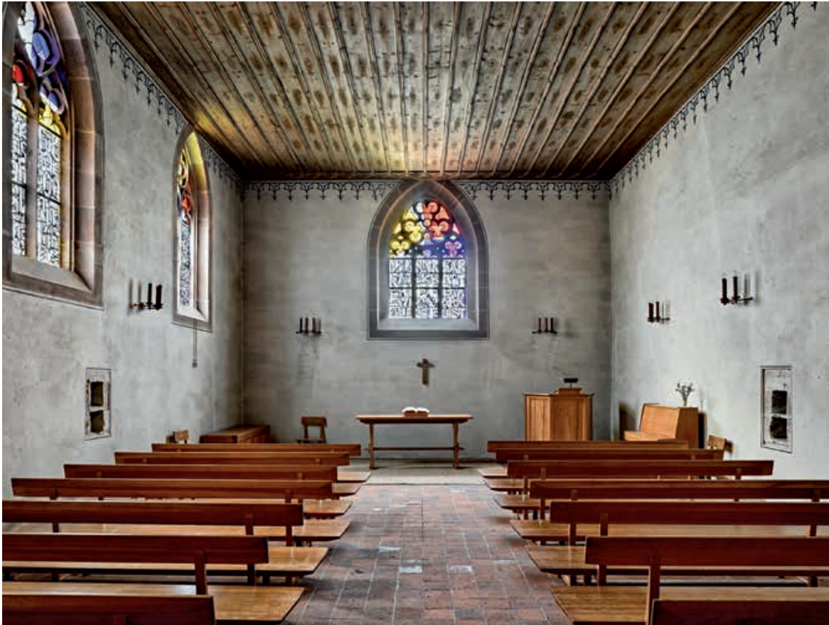
Abb. 1 Niklauskapelle, Blick gegen Osten. Foto Dirk Weiss, 2019