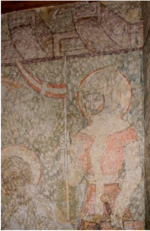
Abb. 7 Detail des Wandbildes an der Südwanne der Orgelempore (vgl. Abb. 6). Gut sichtbar sind die Vergoldungsreste an Schwert und Wehrgehänge des Ritterheiligen. Der heutige Zustand geht auf die Renovierung von 1947 zurück.