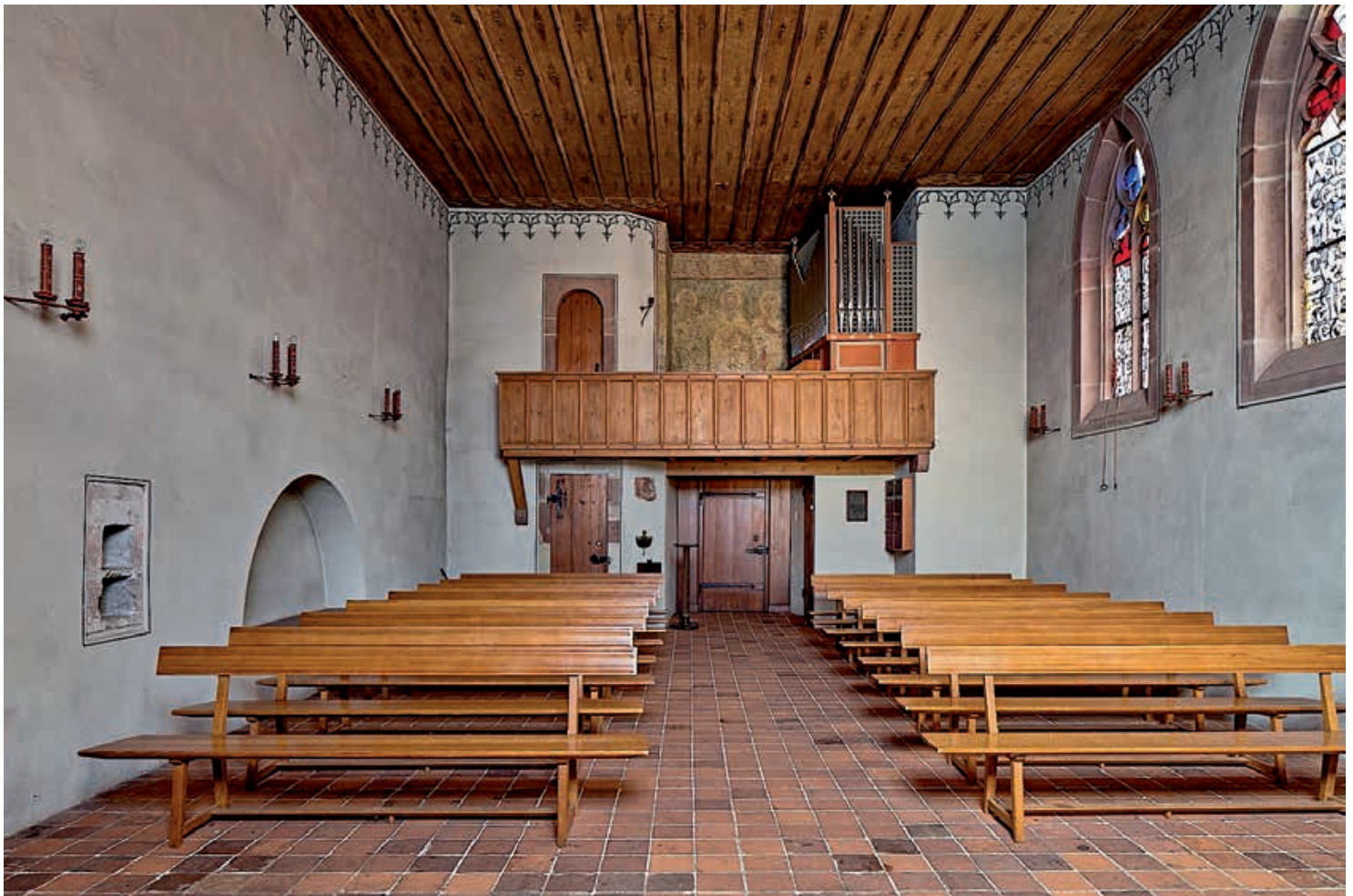
Abb. 2 Niklauskapelle, Blick gegen Westen. Über der Tür die Orgel- empore von 1895, an deren Rückwand die Wandmalereien von Abb. 7 und 8. Die 1895 eingebrochene Rundbo- gentür auf Emporenhöhe zerstörte das Wandbild mit der Kreuzigung (Abb. 3); an der abge- schrägten Kante des Treppentürmchens hing einst ein Kruzifix (vgl. Abb. 6).