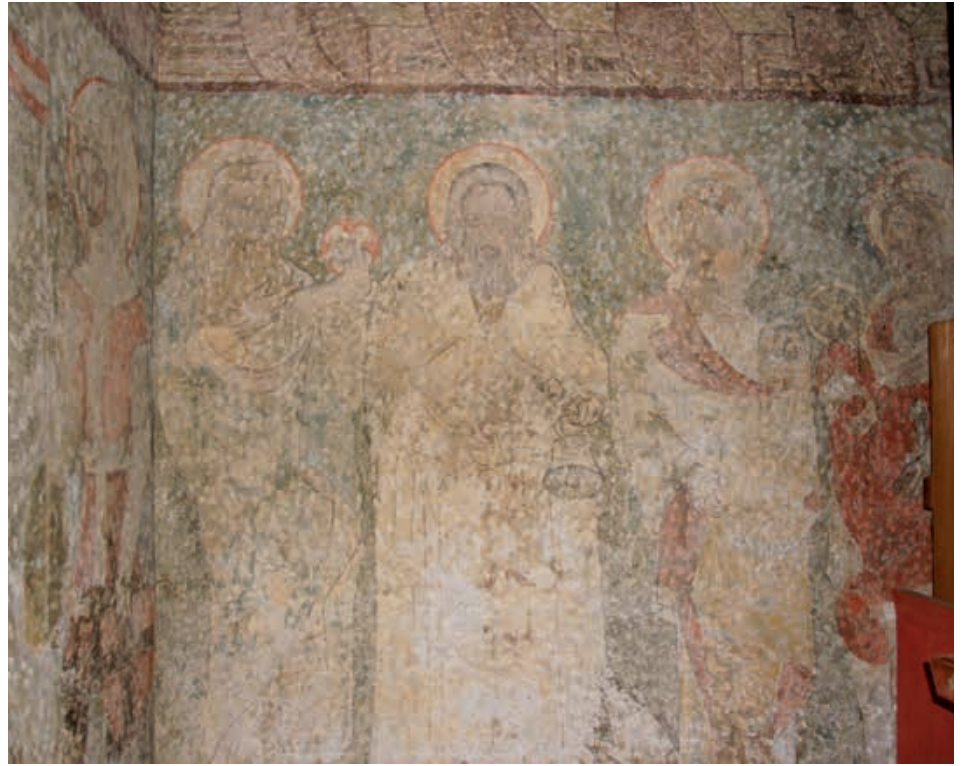
Abb. 8 Heiligenreihe an der Westwand der Niklauskapelle, über der Tür. Von den einst hier angebrachten fünf Heiligen sind nur mehr Johannes der Täufer, Antonius Eremita, Dorothea und Katharina (halb verdeckt durch die Orgel) sichtbar, während Christophorus (vgl. Abb. 4) durch einen Kamineinbau im 19. Jahrhundert zerstört wurde. Der heutige Zustand geht auf die Renovierung von 1947 zurück.

Fortsetzung der Westwand und im Westteil der Südwand zu lokalisieren. 5 Sie zeigten die Kreuztragung (Abb. 4) und das von Maria und Johannes sowie mehreren Heiligen umstandene Kruzifix (Abb. 5). Durch die auffällige gemalte Architekturrahmung mit den sich überschneidenden Masswerkformen lassen sich diese Bilder ins späte 15. oder ins frühe 16. Jahrhundert datieren. Die Maleereien im Bereich der Empore dürften hingegen deutlich älter sein; Stil und Farbpalette, aber auch realienkundliche Details der gemalten Ritterrüstung sowie die Gold- und Silberauflagen sprechen für eine Entstehung um 1400 oder kurz danach. Aus diesen unterschiedlichen Entstehungszeiten ist abzuleiten, dass die Kapelle nicht über eine einheitliche, in einem Guss entstandene Ausmalung verfügte, sondern ihre malerische Ausstattung sukzessive und ohne Masterplan erhielt, je nachdem, welche Bildthemen die in der Kapelle Bestatteten oder ihre Angehörigen wünschten, wie viel Geld sie dafür zu zahlen bereit waren und welche Künstler mit der Ausführung betraut wurden.