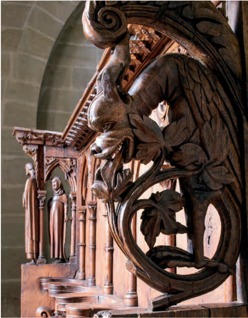
Fig. 7 Dragon ailé sculpté sur une jouée haute. À l'arrière de l'image, se devinent les figures du chantre et du moine. MCAH. Photo Yves André, 2016

portail peint, qui, au contraire, reflètent un monde médiéval ouvert, en plein mouvement, avide de nouveautés. Avec ces œuvres majeures de la cathédrale, c'est bien aussi une histoire de la culture européenne qui est illustrée, les commanditaires étant les uns et les autres très au fait des nouveautés et des courants artistiques et intellectuels de leur temps.