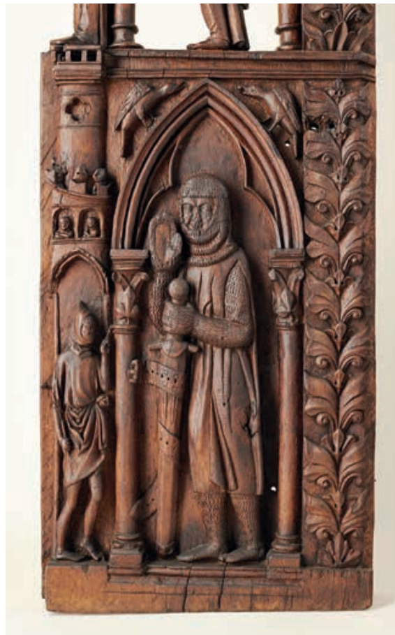
Fig.6 Scène du combat de David contre Goliath. MCAH (LC85/ST.d.1.2).