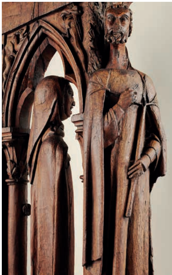
Fig.4 Détail de la jouée haute représentant un diacre et un ange activant un encensoir. MCAH (LC85/ST.d.1.1).