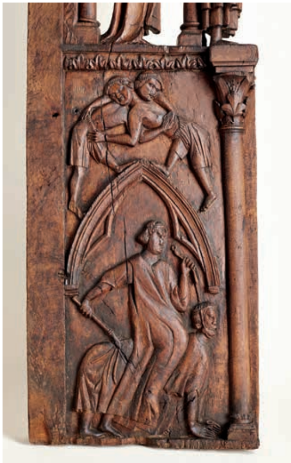
Fig.5 Détail du Lai d'Aristote : Phyllis munie d'un fouet chevauche Aristote tenu en laisse. Au-dessus scène de lutte avec deux personnages tonsurés. MCAH (LC85/ST.g.1.1).