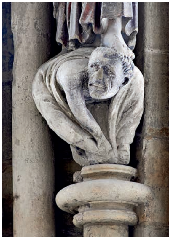
Fig.9 Détail du socle sous Jérémie.

vêtements. La réponse est négative. Cette question souligne la thématique principale sous-jacente : demeure-t-il ou non de condition humaine au moment de la métamorphose ? Conserve-t-il sa substance humaine en changeant d'apparence ? En perdant ses vêtements, le chevalier affirme qu'il abandonne son identité humaine lors de ses transformations.