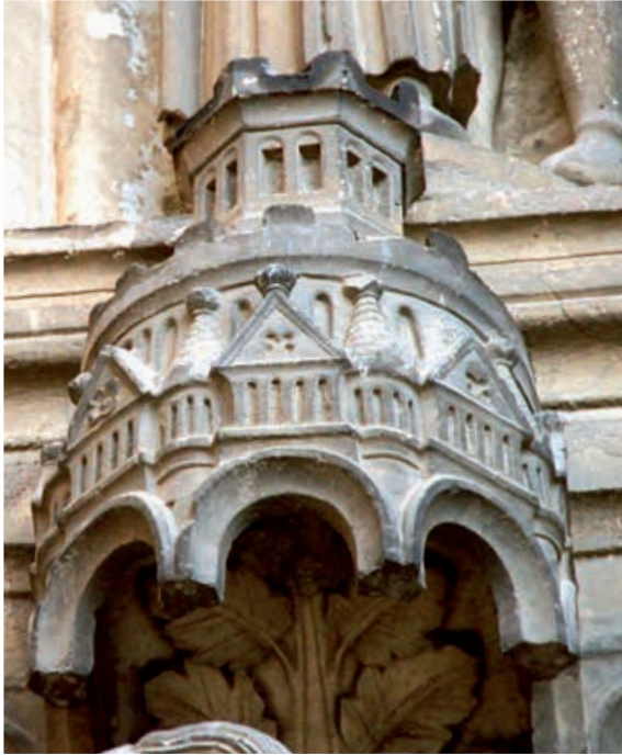
Fig.10 Cathédrale de Chartres, transept sud, portail central, ébrasement droit, détail du dais de la troisième statue-colonne, vers 1220.

du fidèle, ils l'impliquent directement dans le processus spirituel amenant à la repentance. Les textes médiévaux associent les êtres hybrides aux monstres, considérant le monstrum comme un signe qui montre ( demonstrare ) au fidèle une signification cachée 11 . Les Étymologies d'Isidore de Séville font du monstre un élément d'apostrophe, dont la fonction est d'interpeller et de communiquer. Saint Augustin théorise explicitement que le monstre viole la norme, désignant les valeurs physiques et morales en dehors du cadre socialement défini 12 . Le monstre agit comme un signal d'avertissement par la terreur qu'il inspire.