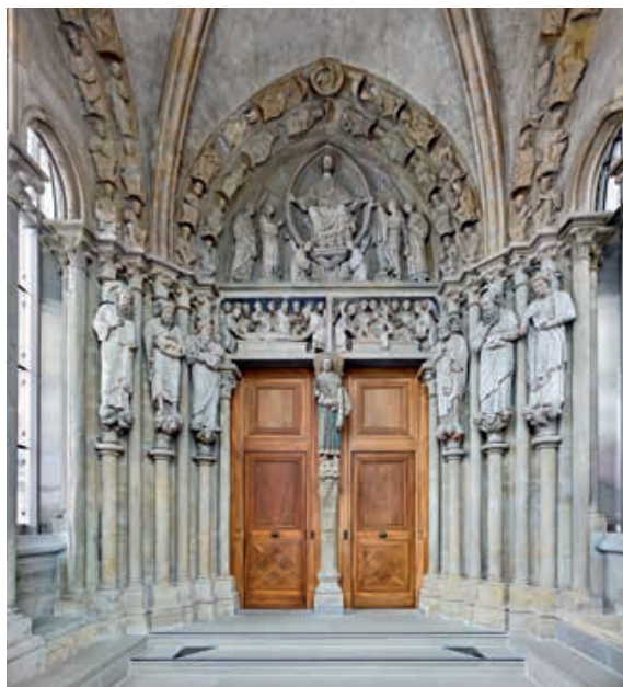
Fig. 4 Statues du porche, en vis-à-vis du portail. Photo Dirk Weiss, 2024