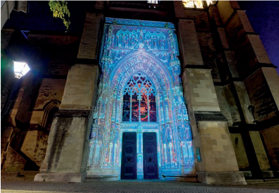
Abb. 7 Festival Lausanne Lumières, Dezember 2020: Montfalcolor -Projektion, die von Patrice Warrener entworfen wurde, um das Eingangsportal der Kathedrale, das sogenannte Montfalcon-Portal, zu beleuchten. Services industriels de la Ville de Lausanne.

Der archäologische Rundgang im Untergeschoss erhielt seine eigenen Vorrichtungen. 9