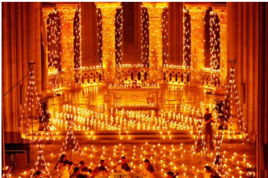
Abb. 8 Zum 40. Jubiläum des Stadtfestivals im Jahr 2011 beleuchtete Renato Häusler (Kalalumen) während eines Konzerts das Innere der Kathedrale mit 850 Kerzen.

gekonnte Anspielung auf unsere Zeit und Kultur, die an die Allgegenwart des Lichts gewöhnt ist. Bei der prunkvollen Beerdigung Philipps des Guten im Jahr 1467 waren im Inneren von St. Donatian in Brügge 200 Flammen aufgestellt worden; Renato Häusler entzündete an einem Abend in der Kathedrale von Lausanne 3700 Flammen. 14 Heute muss sich die Beleuchtung historischer Gebäude hingegen ganz neuen Anforderungen