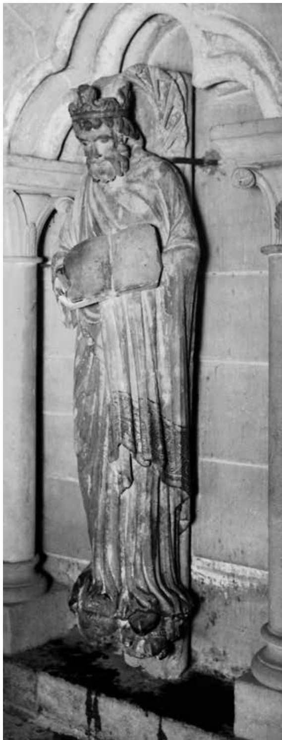
Abb. 6 Eugène Bach, «Polychromie du Portail peint: David». Für die Aufnahme benetzte er den unteren Teil der Skulptur mit Wasser, um die gemalten Verzierungen des Mantels hervorzuheben und so den Kontrast zu erhöhen. Viertes Album: «campagnes de 1941 et 1942». ACV, PP 100/96.

und Aufrissen, darunter auch von seinen eigenen Tafeln. Diese Alben sind von dokumentarischem Wert und spiegeln seine Herangehensweise an das Kulturerbe wider.