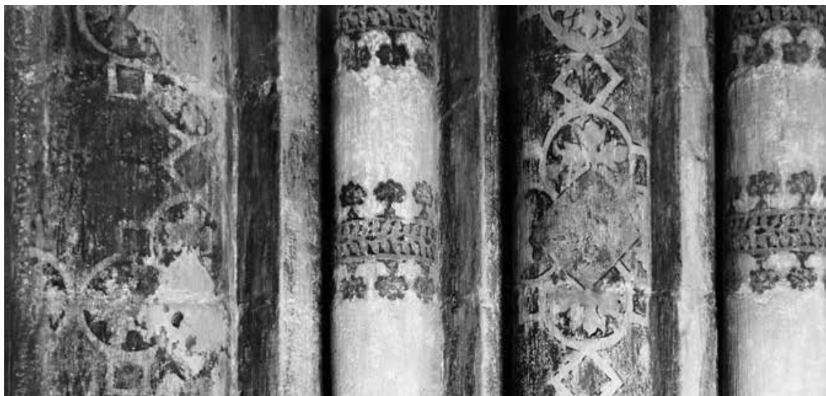
Abb.2 Eugène Bach, Detail der Dekoration des nordwestlichen Pfeilers der Marienkapelle. Abzug aus dem zweiten Album «Sujets spéciaux» der Fotokampagnen von 1935 bis 1938. ACV, PP 100/94. Repro F. Pajor

Dieses Pionierwerk vereint das gesamte Wissen über die Kathedrale von Lausanne. Der Architekt Jean-Daniel Blavignac (1817–1876) hatte jedoch bereits ein Jahrhundert zuvor mit seiner «Description monumentale de l'église Notre-Dame, ancienne cathédrale de Lausanne» (Lausanne/Genf 1845) den Weg geebnet. Dreissig Jahre nach dem Erscheinen des Bandes von Bach, Blondel und Bovy präzisierte eine neue Gemeinschaftspublikation, die anlässlich des 700. Jahrestages der Kathedrale im Jahr 1975 herausgegeben wurde, die Chronologie und brachte unter anderem einen neuen Blick auf die Skulptur und die Glasfenster des Mittelalters mit sich. Marcel Grandjean, Autor des zentralen Kapitels über «Die heutige Kathedrale: ihr