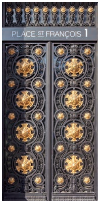
Fig.1 La porte de l'ancien siège de l'Union de banques suisses (1922), œuvre des ferronniers d'art Zwahlen & Mayr.

L'évolution architecturale est rapide. La banque Bugnion, fondée à Lausanne en 1803, occupe des locaux dans la maison familiale sise à l'arrière de la cathédrale du milieu des années 1830 à 1865, date de son déménagement dans d'autres locaux loués à la place Saint-François ; dès les années 1870, une telle situation, instable et sans visibilité, apparaît de plus en plus désavantageuse. La Caisse hypothécaire cantonale est la première à faire édifier un immeuble ad hoc, mixte il est vrai (logements et bureaux) à la place Bel-Air (1875-1878). Cette œuvre de l'architecte Samuel Maget reprend les codes de l'architecture parisienne de son temps : style néo-Renaissance, décor sculpté raffiné, pan coupé marquant l'angle, portail monumental signalant l'entrée de l'établissement (fig. 2 et 3). Ce type d'immeuble mêlant les fonctions est alors courant : on le retrouve par exemple à Genève à la Banque Chenevière, œuvre d'Elysée Goss datant de 1875, dont l'architecture est très similaire à la caisse lausannoise. En raison de la Grande Dépression (1873-1896), peu de chantiers sont à mentionner avant la fin du siècle : l'âge d'or des banques lausannoises sera le premier quart du XX e siècle ; elles vont changer le visage de la ville.