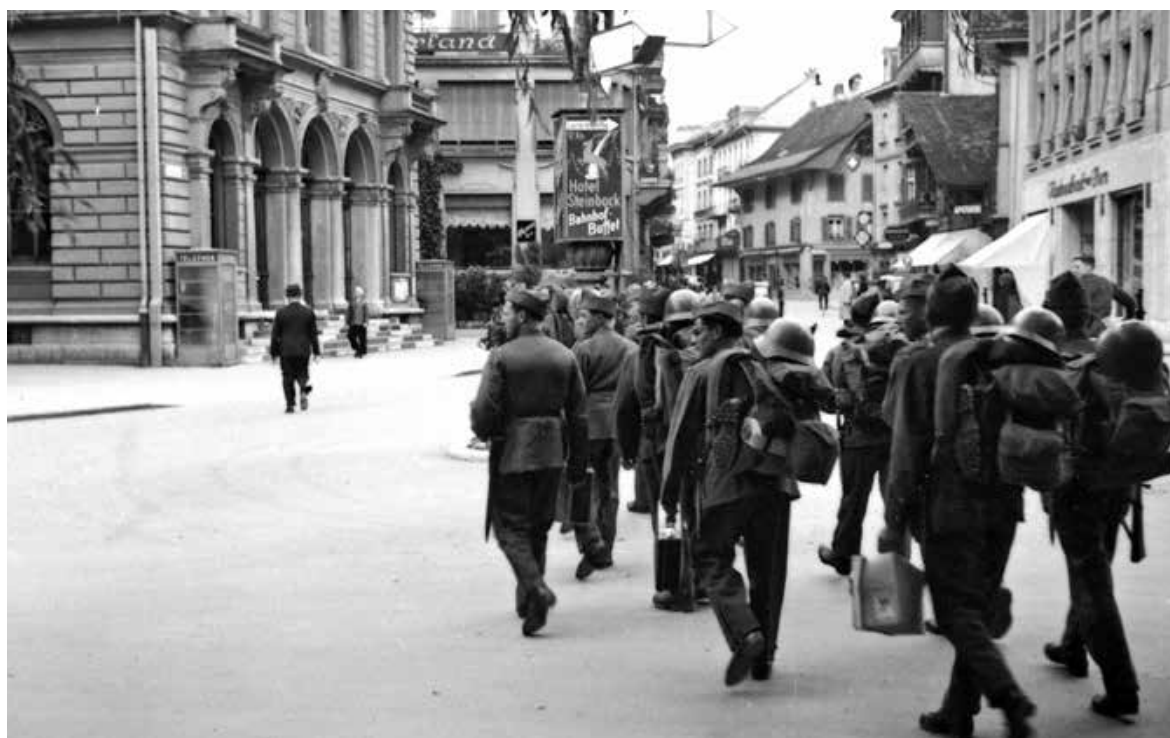
Soldaten, die mit dem Zug in Interlaken ankommen, gehen auf dem Höhenweg in Richtung der Hotels

seine Neutralität aufrechterhielt und zu dieser Zeit eine blühende Wirtschaft und einen regen Aussenhandel hatte. Jüngste Anschuldigungen des Simon Wiesenthal Center haben den Goldexodus der Credit Suisse im Jahr 1942 in ein neues Licht gerückt. Sie argumentieren, dass die Bank «seit mindestens 1942 nachrichtenlose Depotkonten und Portfolios mit Nazi-Vermögenswerten unterhielt» und dass «im Laufe des Krieges prominente Nazi-Familien auch den Vorteil sahen, ihre Besitztümer zu diversifizieren, indem sie Treuhandgesellschaften gründeten, die dazu dienten, Vermögenswerte ins Ausland zu transferieren, unter anderem nach Argentinien. Die Credit Suisse erleichterte diese Transfers für diese Nazi-Familien». 9 Im Januar 1943, wenige Wochen nach der Evakuierung des Goldes von Interlaken nach Argentinien, kündigten die Alliierten an, dass die Briten und Amerikaner nach ihrem Sieg über Nazideutschland das Schweizer Eigentum an den geraubten Vermögenswerten nicht anerkennen würden. 10 Diese Überschneidung von Ereignissen wirft die Frage nach den Beweggründen der Credit Suisse auf, ihre Goldbestände nach Übersee zu evakuieren, und eröffnet die Möglichkeit, dass sie vor den Alliierten ebenso Angst hatte wie vor den Achsenmächten, die ihre Goldbestände beschlagnahmen wollten.