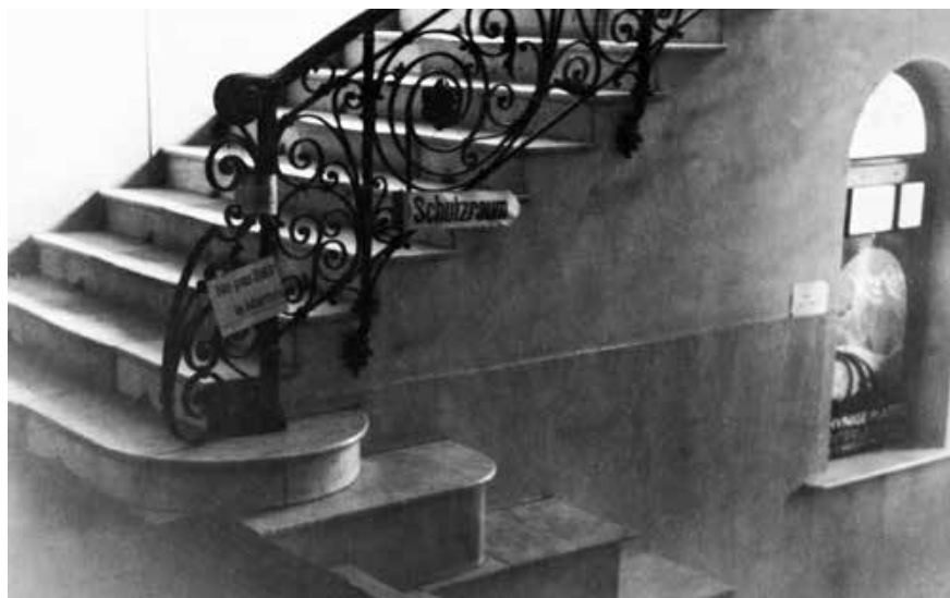
Fotografie des zentralen Treppenhauses des Hotels Savoy mit dem Schild «Schutzraum» im Erdgeschoss, 1943 (Schweizerisches Wirtschaftsarchiv, Basel, SWA PA 554 A 300)