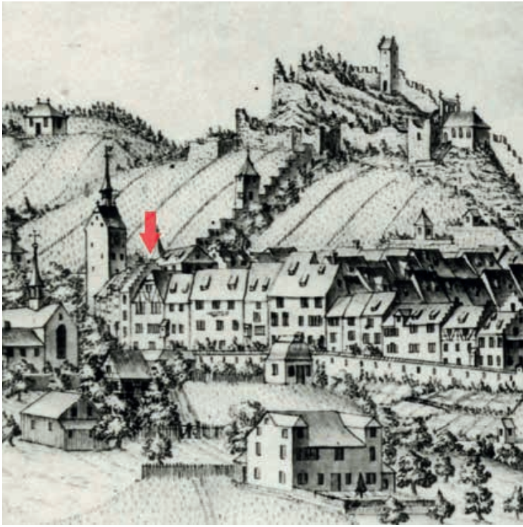
Ausschnitt Federzeichnung von J. C. Nötzli, 1751 (Kantonale Denkmalpflege Aargau)

Badenfahrt erstellten Kulissenarchitektur handelt es sich demnach nicht um eine eigentliche Rekonstruktion, vielmehr, dem Festmotto entsprechend, um eine freie Interpretation oder Illusion des verantwortlichen Künstlers. Als historisierende, raumhaltige Kulisse zeigt sich über einem überhohen Sockel mit spitzbogigem Stadttor ein reich