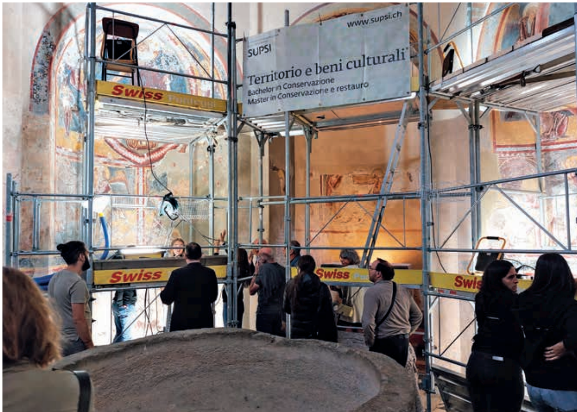
« Abb. 10 Ritterhaus Bubikon. Die vierte Station der Ausstellung «Zoom aufs Denkmal» fokussierte den Blick auf das Stifterbild am Chorbogen der Kapelle.