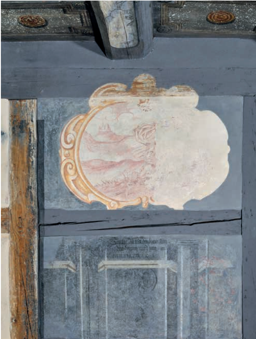
Abb. 4 Mühle Küttigen. Wandmalerei mit Samson-Szene, die rechte Bildhälfte wurde durch den Einbau eines Ofenrohrs zerstört.

die hier oft langsam verstreicht» 2 . Gleichwohl gelang es Rahn, mit seiner unorthodoxen Freilegungsaktion die öffentliche Aufmerksamkeit auf das vernachlässigte Kulturerbe zu lenken und es damit der Nachwelt zu bewahren.