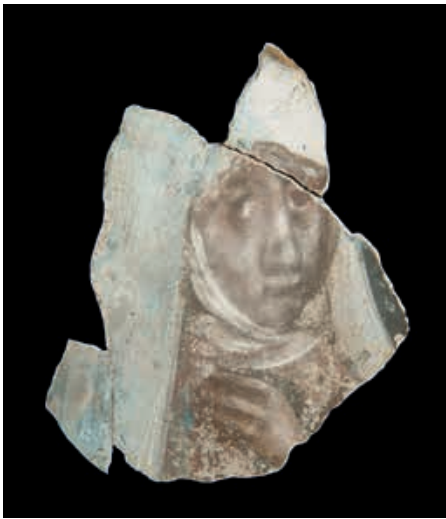
Abb.6 Bernisches Historisches Museum, Inv. Nr. 124415. Arbeitsfotografien aus der Inventarisierungskampagne von barocken Wandmalereifragmenten unbekannter Provenienz, die noch manches Bilderrätsel aufgeben.