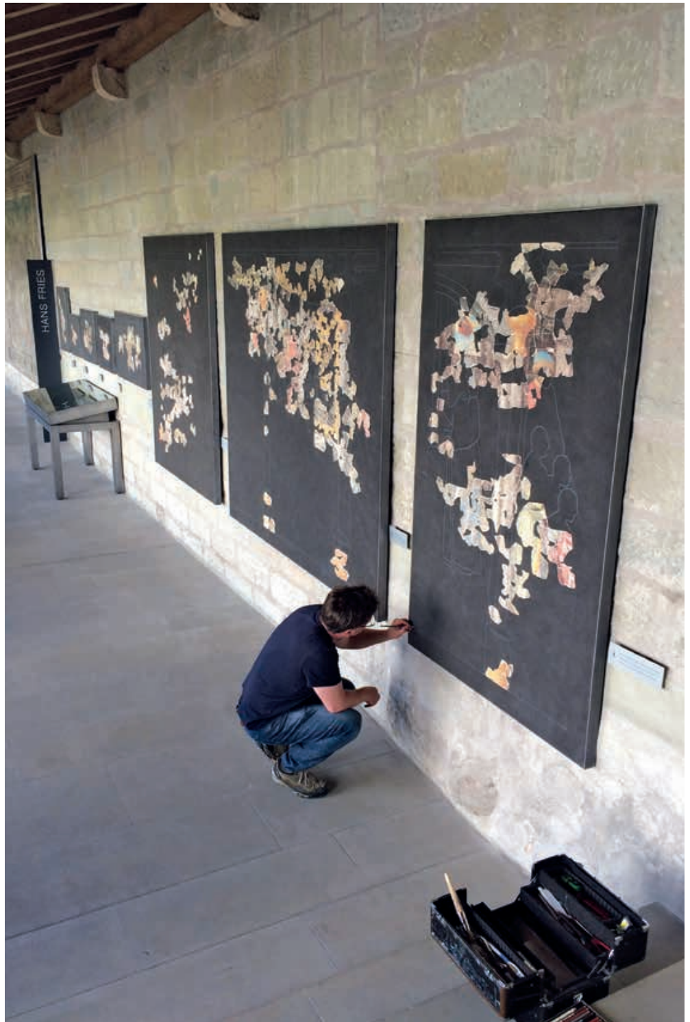
Abb.8 Franziskanerkloster Freiburg. Ausstellung der Hans Fries zugeschriebenen Wandmalereifragmente im Kreuzgang.