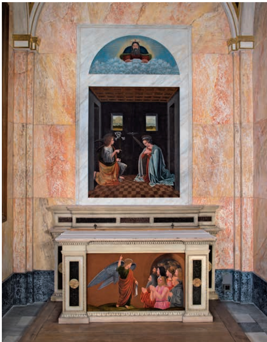
Bernardino De Conti, Ancona dell'Annunciazione , 1502 ca., tempera grassa su tavola.

superiori, ed era in origine dedicata all' Ascensione . Ospita un gruppo plastico raffigurante il tema della Resurrezione, uno dei dogmi fondamentali e caratteristici del Cristianesimo, con Gesù risorto, un angelo e tre soldati, opera di Alessandro Rossi (1886).