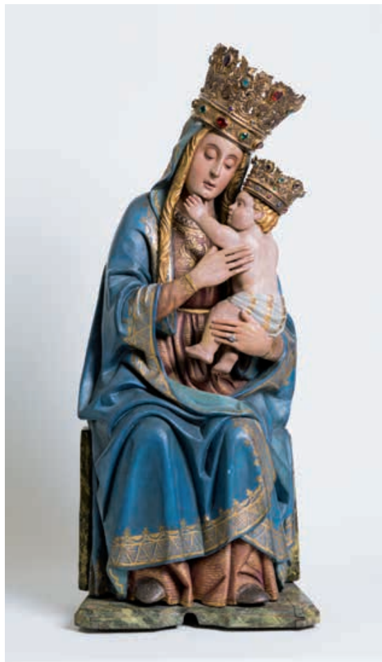
Maestro di Santa Maria Maggiore, Madonna in trono con il Bambino (Madonna del Sasso) , 1487 ca., legno policromo e dorato.