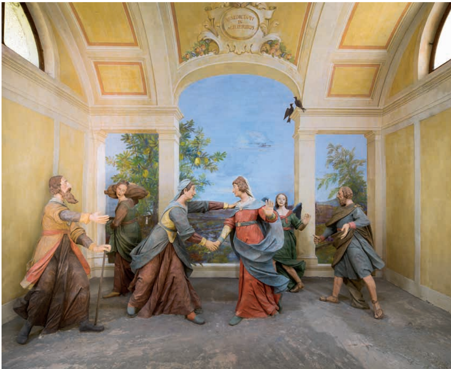
Cappella della Visitazione.