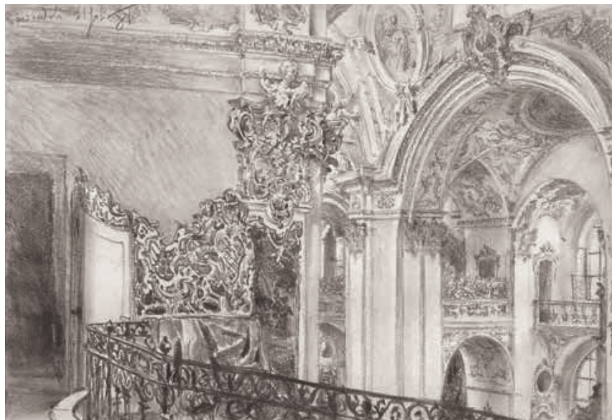
Abb. 1 Blick von der Empore in die Kirche von Einsiedeln (28,8×42 cm). Nationalmuseum Warschau (Inv. Nr.RYS. Nm. XIX 1388)

Die erste der drei grossen Zeichnungen, die sich heute in Privatbesitz befindet, gibt einen Ausschnitt des Chors in der Stiftskirche wieder (Abb. 2). 4 Der Blick wird von oben nach unten geführt: Vom Gewölbe gleitet er dem Wandpfeiler entlang an Engeln vorbei, die auf dem Gesims sitzen. Der Wandpfeiler ist mit Pilastern und Kapitellen reich geschmückt und bildet die Rückwand