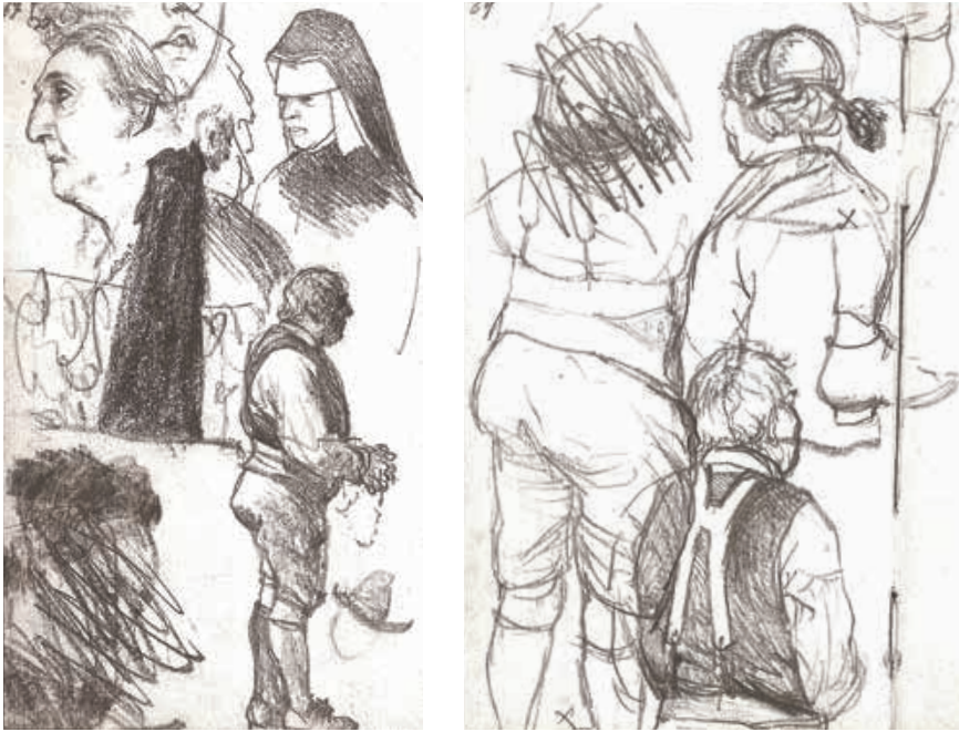
Abb. 4 Blick auf jedes Detail: Pilger mit Rosenkranz (14,7×8,7 cm). Kupferstichkabinett der Staatlichen Museen zu Berlin