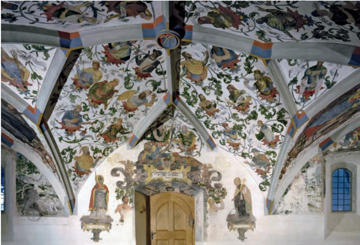
Kloster Marienberg, Rorschach. Im Kapitelsaal überzieht die Renaissancemalerei alle Gewölbefelder. Wurzel Jesse mit dem schlafenden Jesse über dem Portal.

gebracht, 1749 das Kornhaus eingeweiht. Das Erdgeschoss ist gewölbt, die oberen Stockwerke bestehen aus einem engen Raster von Holzstützen und Unterzügen. Obwohl das Innere nur freie Lagerflächen enthält, ist das Äussere wie ein Palast mit reicher Architekturgliederung versehen. Urnen mit Korn bekrönen die Giebel der Seitenrisalite.