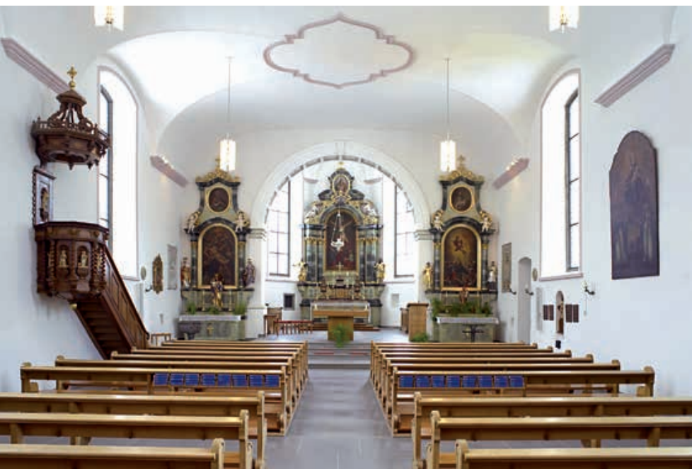
Die Propstei St. Peterzell im abgelegenen Neckertal. Sowohl der neubarocke Turmaufsatz von August Hardegger als auch die Altardisposition entstanden um 1889–1891.

gebäuden hält das Haus der Stille St. Peterzell die Tradition klösterlicher Gastfreundschaft und Einkehr aufrecht, während im Estrich 2004/05 Räumlichkeiten für Ausstellungen und kulturelle Anlässe geschaffen wurden.