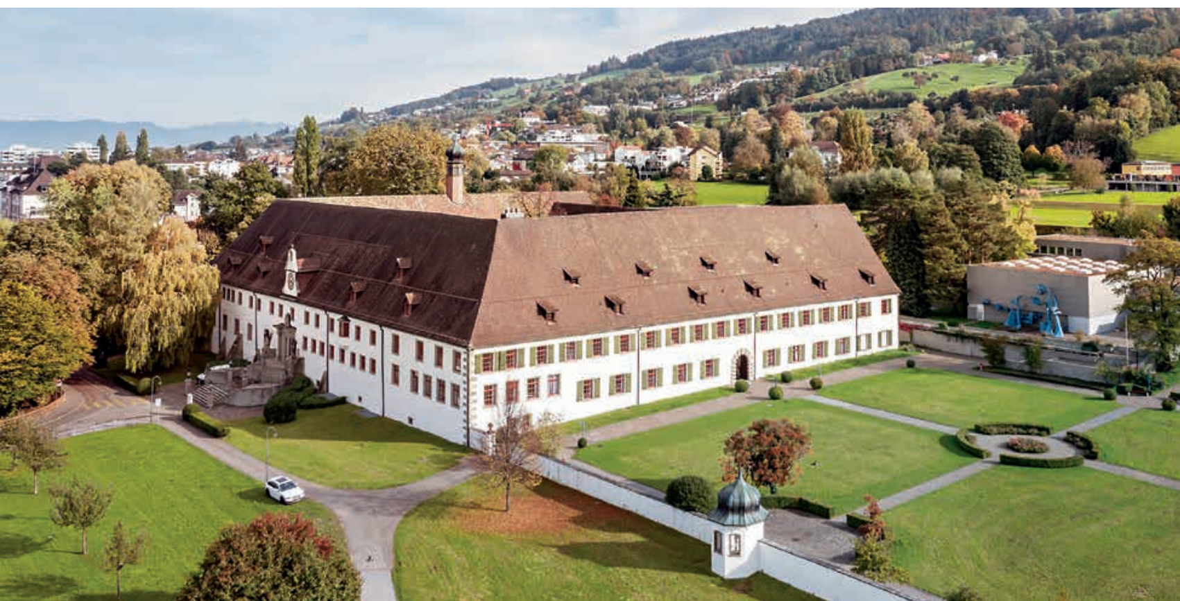
Kloster Marienberg, Rorschach. Auf der Bergseite wäre die Kirche geplant gewesen, der Dachreiter auf dem Osttrakt markiert den als Marienkapelle genutzten Kapitelsaal.

Baubeginn war 1487, nach zwei Jahren waren der Kreuzgang mit dem Ostflügel bereits vollendet und der Kapitelsaal als Marienkapelle geweiht –