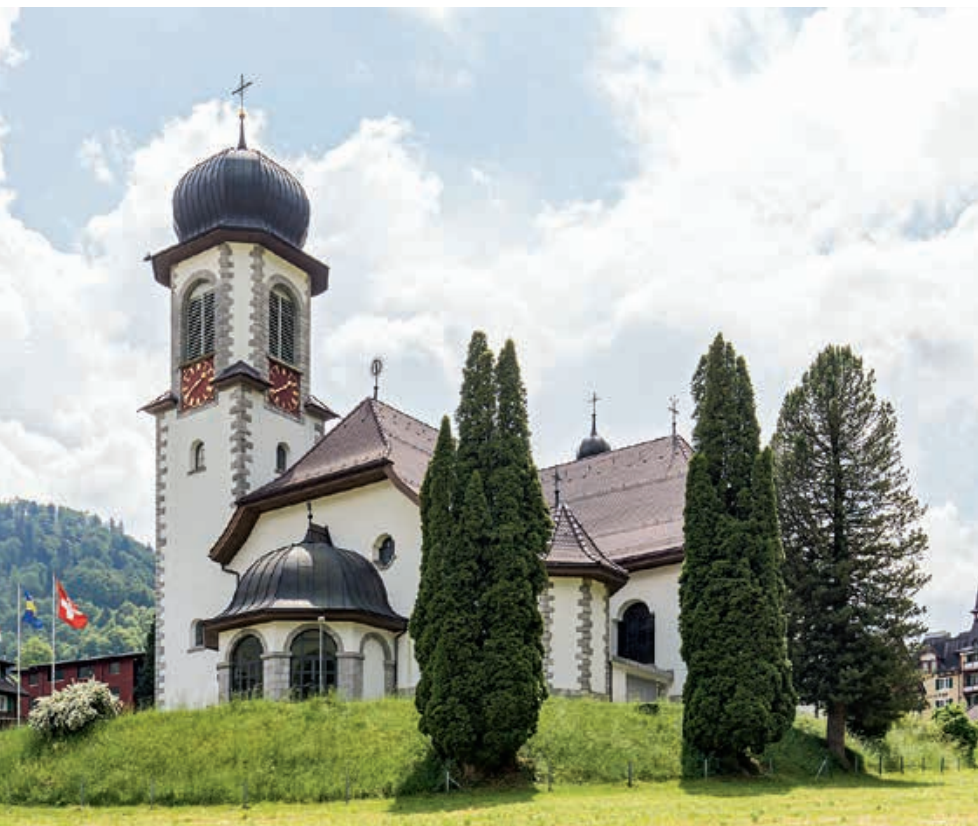
Die heutige Wallfahrtskirche Maria Melchtal wurde im Jahr 1928 im neubarocken Stil erstellt: mit einschiffiger Saalkirche, polygonalem Choranschluss, seitlich angebauten Kapellen und prachtvoller Innenausstattung.

sie 1761 ins Melchtal übertragen. Das erzählen Legende und Geschichte. Es entwickelte sich eine allmählich zunehmende Wallfahrt, wofür die zahlreichen Votivtafeln in der heutigen Kirche ein lebendiges Zeugnis sind.