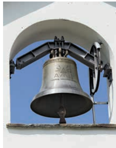
Sakrale Alparchitektur auf der sogenannten «Vierseenwanderung»: die Kapelle auf der Aastafel (links oben und Mitte), auf der Frutt (rechts oben) und auf der Tannalp (links und rechts unten); allesamt 1765 eingeweiht und durch spätere Neubauten ersetzt.

schen Formen, die ihm eine verhaltene Monumentalität verleihen, ein charakteristisches Beispiel der Schweizer Baukunst in der Zeit des Zweiten Weltkriegs.