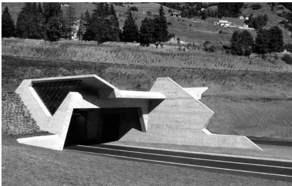
Fassade des Untergrunds: das elegant gestaltete Portal des Gotthard- Strassentunnels von Rino Tami.

Selbstverständlich ist der Untergrund auch eine Welt, die von technischen Anlagen durchzogen und massgeblich bestimmt wird. So nimmt der Untergrund die Infrastruktur auf, der wir die Annehmlichkeiten unseres Alltags verdanken. Energieversorgung, Abwasser und Kommunikationsübertragung liegen unter der Erde. Der Untergrund sorgt schon seit Jahrzehnten dafür, dass Einrichtungen, die unsere Umwelt sowohl ästhetisch als auch hygienisch beeinträchtigen würden, aus dem Blickfeld verschwinden. Das führt dazu,