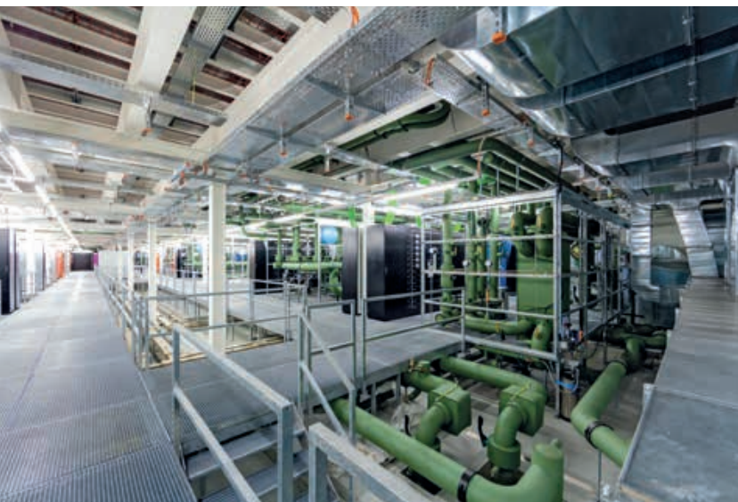
Piano distribuzione: dettaglio del circuito di raffreddamento di Piz Daint.