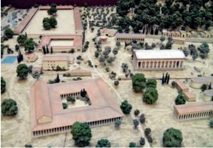
Modell im Massstab 1:200 der antiken Anlage von Olympia um 100 v. Chr. (Ausschnitt), British Museum, London.

von Lehrmitteln für den Turnunterricht, die in der ganzen Schweiz verwendet wurden. Die Kommission legte Normalien fest, das heisst, die Kantone und Gemeinden erhielten Bauvorschriften für die Turnhallen und die Geräteeinrichtungen. Der Eidgenössische Turnverein ETV übernahm ab Ende des 19. Jahrhunderts Aufgaben im Bereich der Ausbildung von Turnlehrern zusammen mit dem Schweizerischen Turnlehrerverein STLV. Dadurch erhielt das Turnen in seiner klassischen Form ein Gewicht, das sich im Turnhallenbau stark manifestierte. Die einschlägigen Geräte wie Reck und Schaukelringe beeinflussten die Masse einer Halle, und die übrigen Geräte, wie zum Beispiel der Barren, benötigten entsprechende Nebenräume. Auch Kletterstangen und Klettertaue gehörten zur Standardausrüstung, und Finanzierungsbeiträge des Bundes waren davon abhängig, dass gemäss den Normen gebaut wurde.