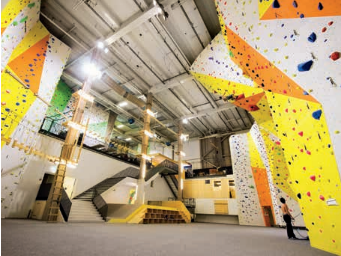
Kletterhalle in Winterthur. Da sich Klettern in den vergangenen Jahren zur Trendsportart entwickelt hat, wächst die Nachfrage nach solchen Bauten ständig. Hier kann wetterunabhängig trainiert werden.