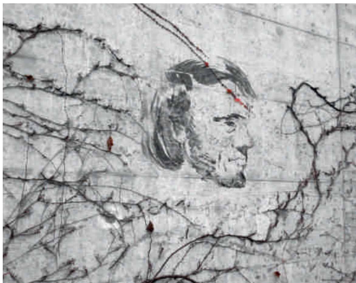
Strafanstalt Zug, Wandzeichnung von Pavel Pepperstein im dritten Geschoss, Sphäre der Götter.