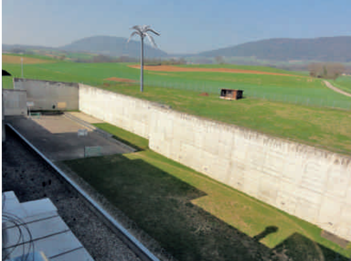
Strafanstalt Gorgier, Le Palmier , Kunst-am-Bau-Projekt von Christian Gonzenbach (noch nicht realisiert), Ansicht aus dem Gefängnis heraus. Digitale Montage des Künstlers aus dem Projektdossier

beit in Räumen zu platzieren, wo sich Menschen unfreiwillig aufhalten. Und sei die Kunst noch so angenehm in ihrem Anblick – sie wird wohl oder übel mit einer Schicht der Angespanntheit und Zwanghaftigkeit überzogen. Da das Gefängnis aus seinem natürlichen Zweck heraus den Straffälligen die Freiheit nimmt, sind das Haus und insbesondere seine Wände Medium und Symbol dieses Entzuges.