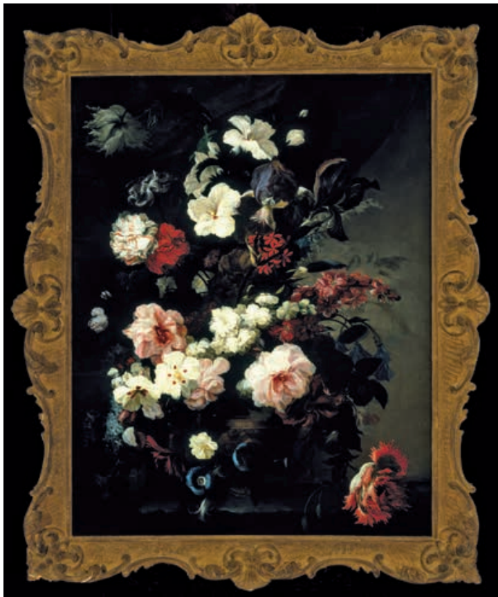
Fig. 12 Mary Moser, Vase de fleurs , v. 1780, huile sur toile, 86,4 × 66,7 cm, New York, Brooklyn Museum, inv. 64.92.5.