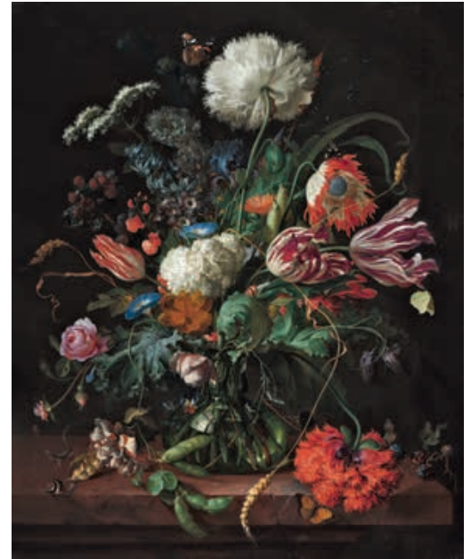
Fig. 7 Jan Davidsz. de Heem, Vase de fleurs , v. 1660, huile sur toile, 69,6×56,5 cm, Washington, National Gallery of Art, inv. 1961.6.1.

Spring et Summer ne présentent ni les mêmes fleurs ni la même structure. La forme générale des bouquets renvoie à des modèles néerlandais distincts, d'époques éloignées. Spring se rapproche de l'art d'Ambrosius Bosschaert (1573-1621) (fig. 5) ou Jacob Marrel (1614-1681) (fig. 6), où les fleurs de couleurs vives se détachent les unes des autres sous une lumière uniformément diffusée. La masse florale dense et le clair-obscur de Summer évoquent en revanche l'art de la seconde moitié du XVII e et du début du XVIII e siècle, dont les principaux représentants – Jan Davidsz. de Heem (1606-1684) (fig. 7), Rachel Ruysch (1664-1750) et