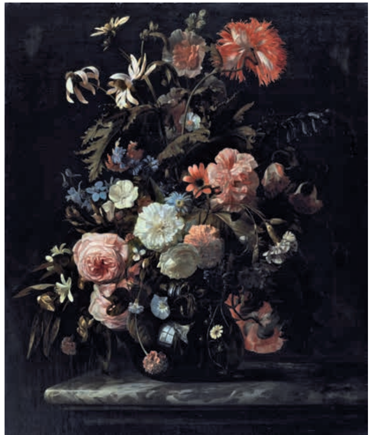
Fig. 13 Simon Verelst, Vase de fleurs , date inconnue, huile sur toile, 78,7 × 64,8 cm, Cambridge, Fitzwilliam Museum, inv. 314.

similaires, disposées sur les mêmes axes; elle rivalise cependant avec son modèle en intensifiant les contrastes et en refusant une touche trop nette 8 .