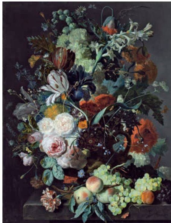
Fig. 9 Rachel Ruysch, Vase de fleurs , 1704, huile sur toile, 84×67 cm, Detroit, Detroit Institute of Arts, inv. 1995.67.