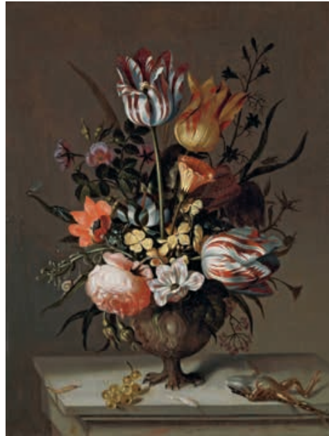
Fig. 6 Jacob Marrel, Vase de fleurs avec une grenouille , 1634, huile sur bois, 40×30 cm, Amsterdam, Rijksmuseum, inv. SK-A-772.