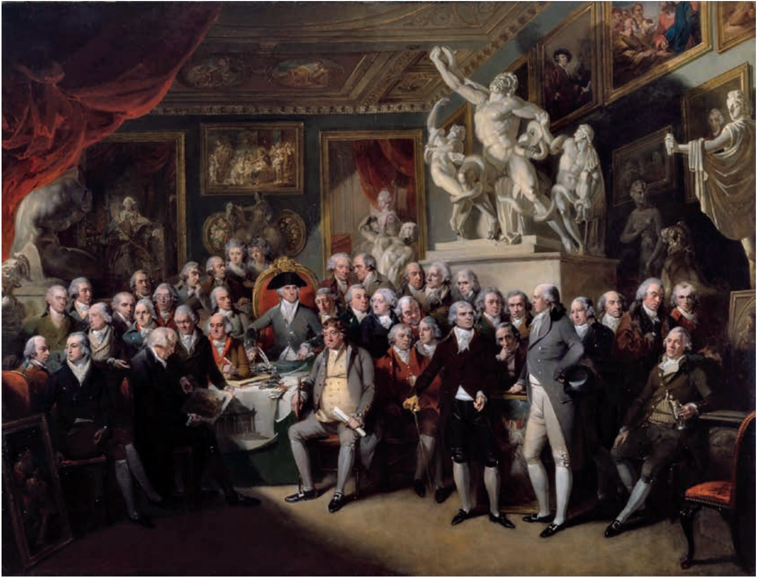
Fig. 15 Henry Singleton, The Royal Academicians in General Assembly, 1795, huile sur toile, 198,1 × 259 cm, Londres, Royal Academy of Arts, inv.03/1310.