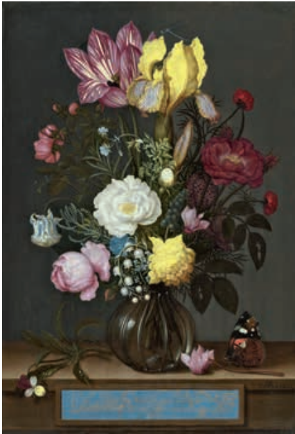
Fig. 5 Ambrosius Bosschaert, Vase de fleurs, 1621, huile sur cuivre, 31,6×21,6 cm, Washington, National Gallery of Art, inv. 1996.35.1.