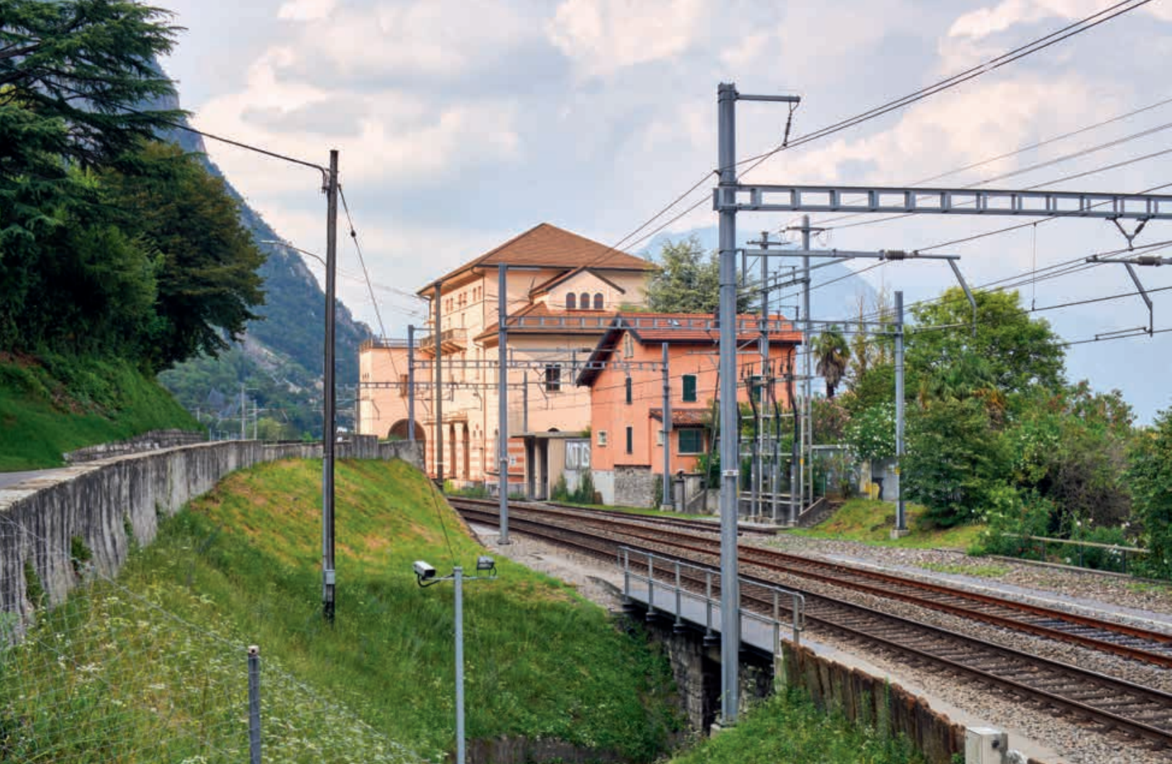
La sottostazione FFS di Melide, 1919-21. Foto Tonatiuh Ambrosetti, 2023

parallelo alla valle e di conseguenza perpendicolare alle condotte forzate che scendono per 1570 metri lungo la montagna (la pendenza è del 230% e il salto è di 850 metri).