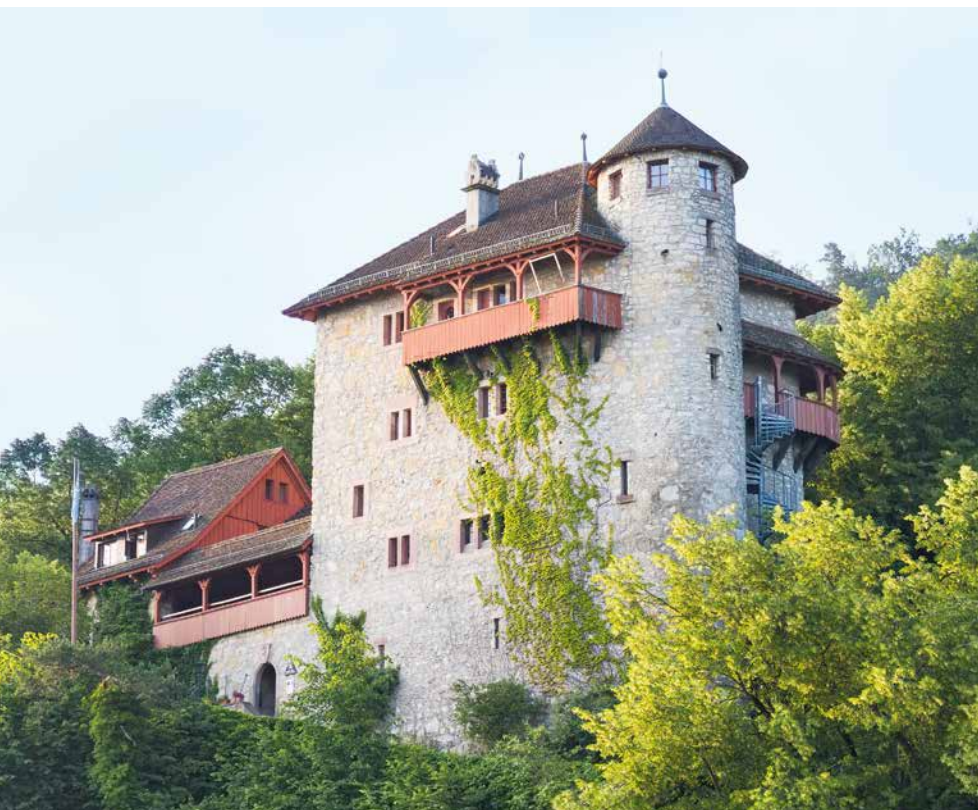
Abb. 7 Ansicht der Jugendherberge Rotberg.