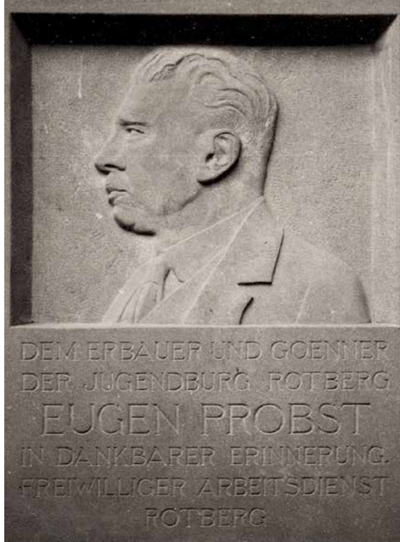
Abb. 8 Die Erinnerungstafel, gestiftet am 3. Juni 1939: «Dem Erbauer und Goenner der Jugendburg Rotberg Eugen Probst in dankbarer Erinnerung. Freiwilliger Arbeitsdienst Rotberg» (NB, EAD-PROB, Erinnerungen, Artikel 32, S. 86)

Für Eugen Probst war Deutschland im frühen 20. Jahrhundert das Land, wo er «auf kulturellem Gebiet am meisten Anregungen erhalten konnte. Seien es die freien Künste, Literatur [und] Denkmalpflege» 27 . Sein Schaffen ist deshalb eng mit der Heimatschutzbewegung verbunden, was die von ihm projektierten und realisierten Bauten in Altdorf, Basel, Davos, Winterthur oder Zürich belegen. 28 Er nahm den Heimatschutzgedanken auf und berief 1903 eine Konferenz nach Samedan ein, «um die Idee eines schweizerischen Heimatschutzes zu diskutieren», mit dem Ziel, nach dem Vorbild des Königreichs Sachsen «eine analoge Institution zu gründen» 29 . Drei Wochen nach