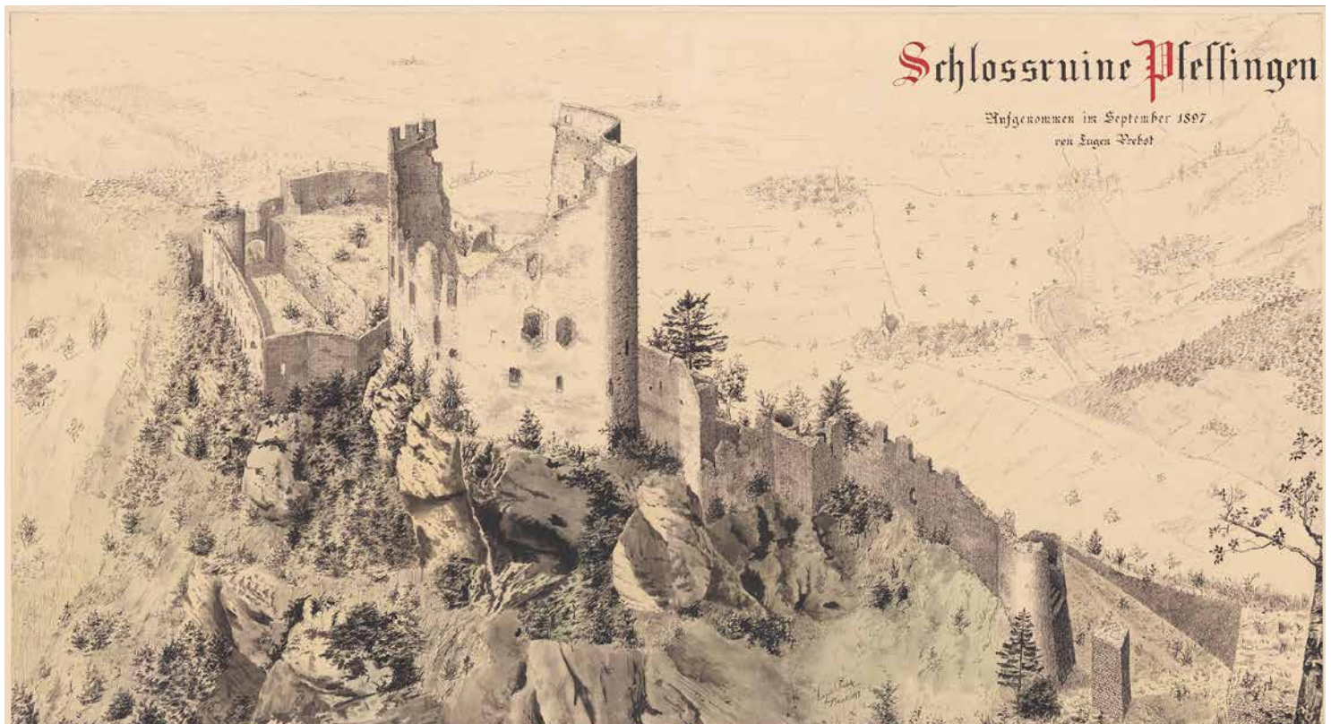
Abb. 3 Die Schlossruine Pfeffingen, von Eugen Probst im September 1897 aufgenommen und perspektivisch in Szene gesetzt. Tusche und Aquarell (NB, EAD-711)

Im Auftrag der Schweizerischen Gesellschaft für Erhaltung historischer Kunstdenkmäler hatte Probst 1898 für die Restaurierung von Schloss Sargans wiederum eine umfangreiche Baudokumentation zusammengestellt und ein Konzept für dessen Restaurierung erarbeitet (Abb. 4). Die hohen Kosten wurden von der Expertenkommission des Bundes zwar genehmigt, doch Probsts invasive Eingriffe stiessen zu Recht auf Widerstand, da sie mit der 1893 erlassenen Anleitung zur Erhaltung von Baudenkmalern und ihrer Wiederherstellung unvereinbar waren. In Anlehnung an die vom Royal Institute of British Architects erarbeiteten