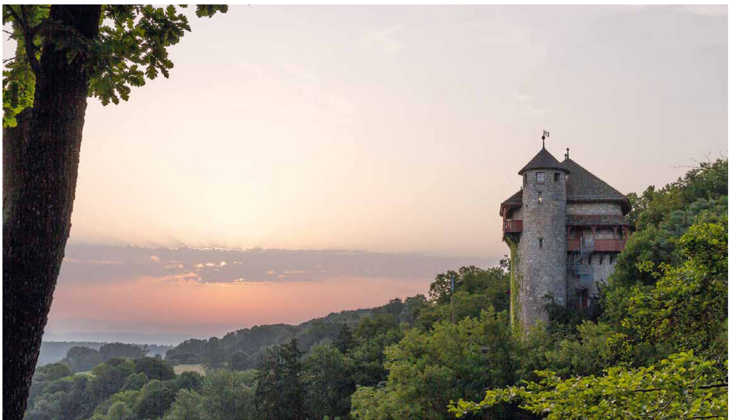
Abb. 13 Abenddämmerung auf der Burg Rotberg – deutlich sichtbar wird ihre markante Stellung in der Landschaft bei Mariastein SO.